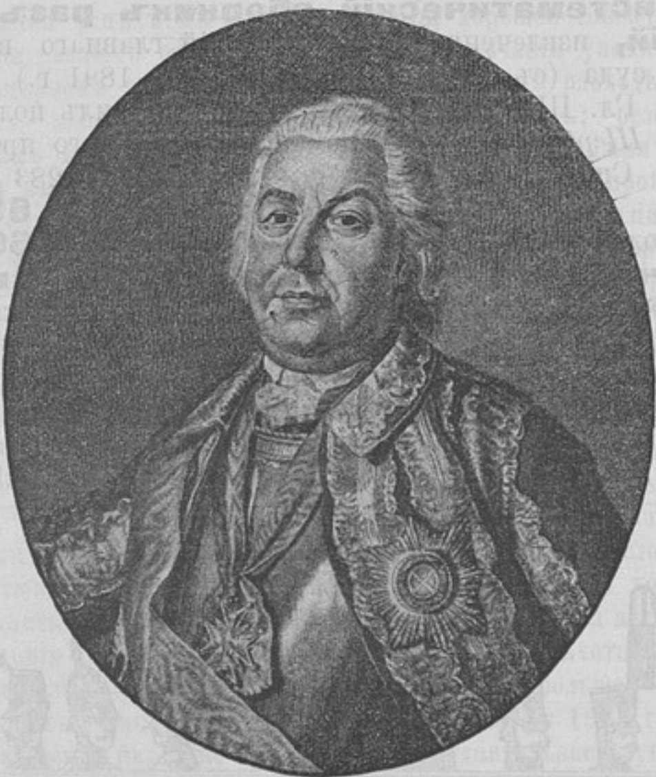
Графъ П. С. Салтыковъ.

Прибывъ къ арміи, сосредоточенной у Познани, гр. Салтыковъ тотчасъ же рѣшилъ вопросъ о дальнѣйшемъ направленіи операций, имѣя въ виду дѣйствія на Берлинъ. Обязанный однако согласовать свои дѣйствія съ планами австрійскаго главнокомандующаго Дауна, гр. Салтыковъ былъ приведенъ въ полное недоумѣніе поступками послѣдняго, такъ что вынужденъ былъ донести: ...«но въ точное ихъ (австрійцевъ) намѣреніе вникнуть не могу — развѣ въпредъ сію тайность открыть способность найду ». Разбивъ 11-го іюля прусскаго ген. Велеля подъ Пальцигомъ, гр. Салтыковъ двинулся къ Франкфурту на Одерѣ и 20-го іюля занялъ этотъ городъ. Въ это время Фридрихъ Великій, опасаясь за свою столицу, пошелъ на встрѣчу Салтыкову и заставилъ его принять бой на высотахъ Куннерсдорфа, около Франкфурта. 1-го августа разыгралось Куннерсдорфское сраженіе, окончившееся совершеннымъ пораженіемъ Фридриха Великаго; трофеями Куннерсдорфской побѣды были: 26 знаменъ, 2 штандарта, 172 орудія и огромное количество огнестрѣльныхъ припасовъ. Въ награду за побѣду, гр. Салтыковъ былъ возведенъ Императрицею Елизаветою въ фельдмаршальское достоинство, а отъ короля польскаго пожалованъ орденомъ Бѣ-