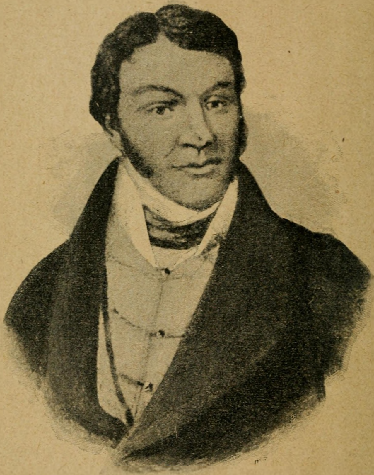
Григорий Квітка - Основяненко.