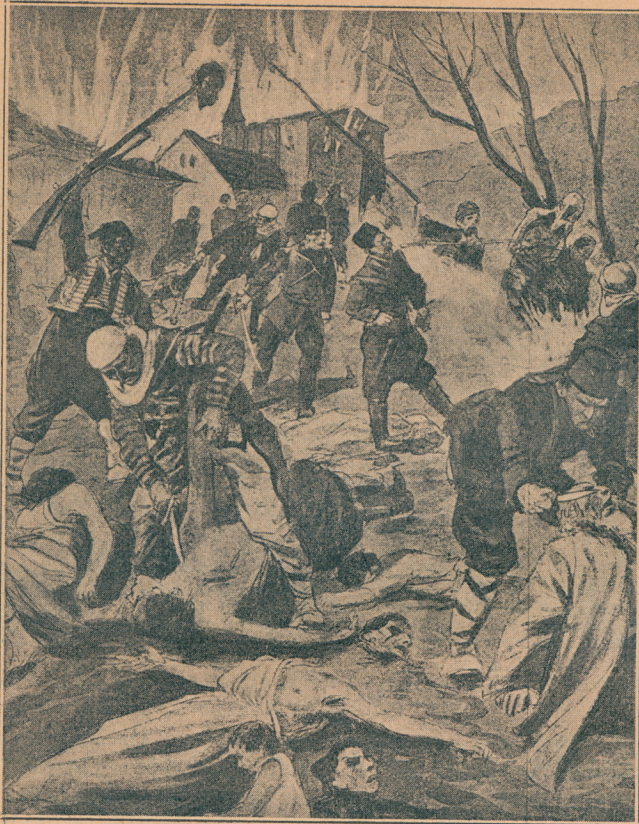
Турска зверства: Турци у бегству, видећи да се никад више неће вратити у Стару Србију, каспе Србе

а Турци осуше топовску паљбу. Из једног села лети граната а ми извили главе и гледасмо где ће да удари. Правац је био одличан, али је одстојање било погрешно. Граната пребаца читавих сто метара. За првом полети друга, па трећа граната, а за њима се осу безброј. Удариле су све у једно место. Пешаци полегали поред нас и гледају како гранате падају на једно место. Наста једна смејурија. Тако се оугла да ич не мариш, кад те не удари.