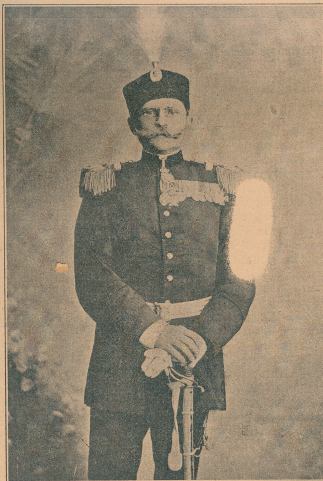
ГЕНЕРАЛ ПАВЛЕ ЈУРИШИЋ ШТУРМ, први ађутант краља Петра, шеф штаба армије престоло- наследника Александра, војсковођа и јунак