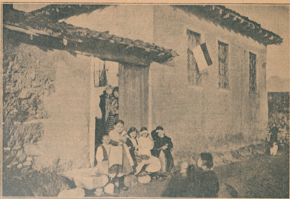
Ведар је дан, сунце сија, деца српска у Скопљу очекују српску војску

*) Једни певају код бијеле Грачанице цркве.