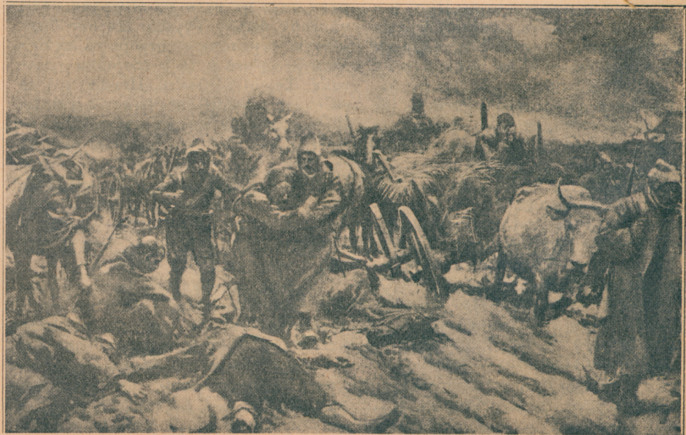
Турци у бегству после битке у Битољу или како свршава Турска у Старој Србији