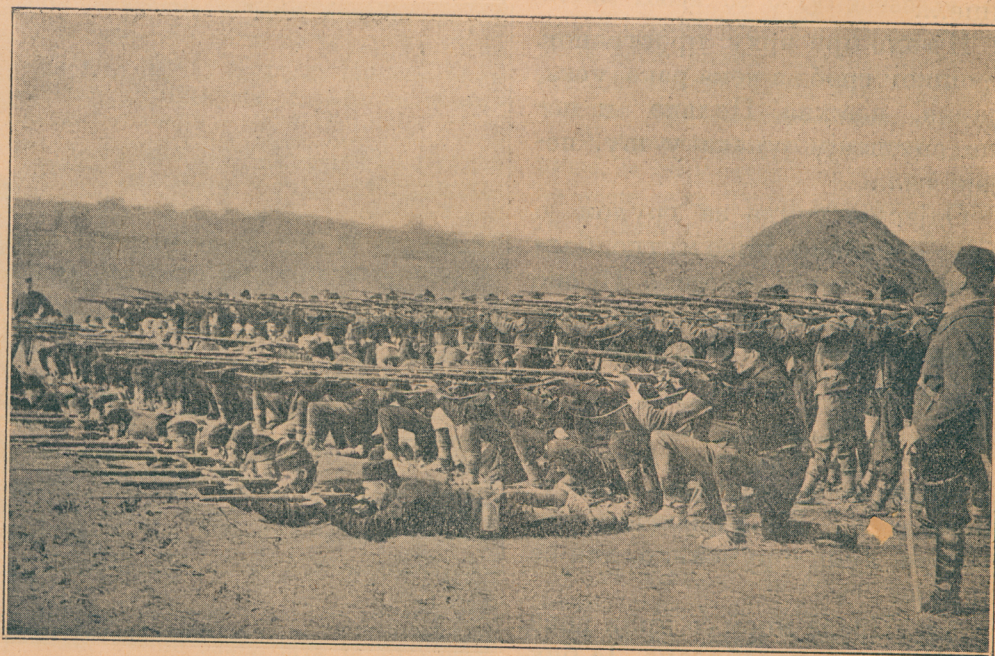
Војници трећег позива српске војске, добри домаћини у миру, јунаци у рату

Прво сандук мали чамов сан- дук, четири беле, грубо отеса- не даске. Тра—тра—ти—тра.... полако, лено, ногу пред ногу