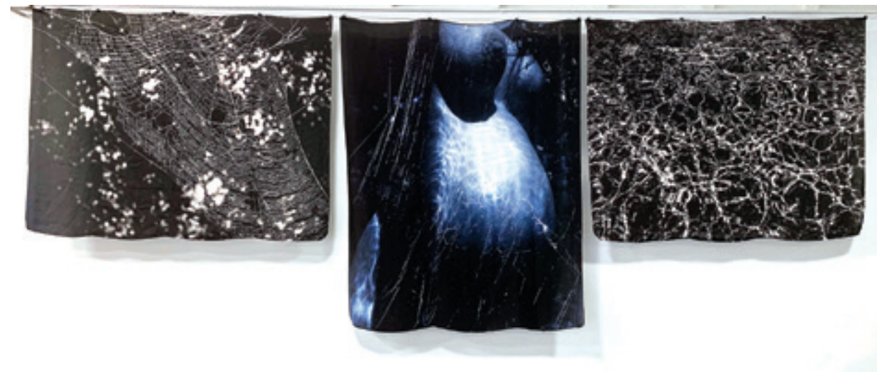
Isidora Gajić „Majka” 2020; triptih na svili; 170 x 385 cm