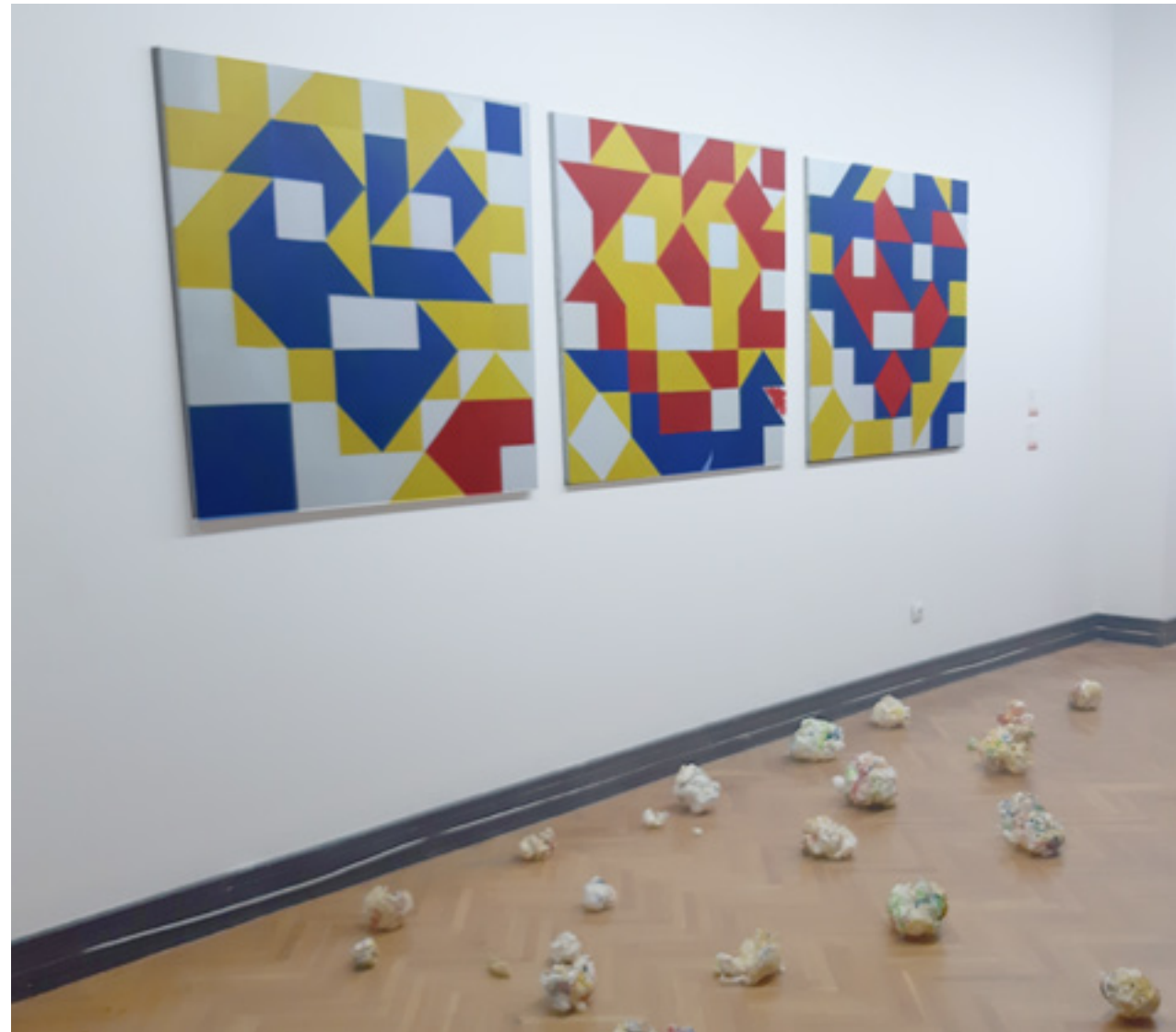
Era Milivojević „Antisluka: Aždaja ubija Sv. Đorđa” akril na platnu; 360 x 120 cm i „kese sa likovnih smećem”, promenljive dimenzije