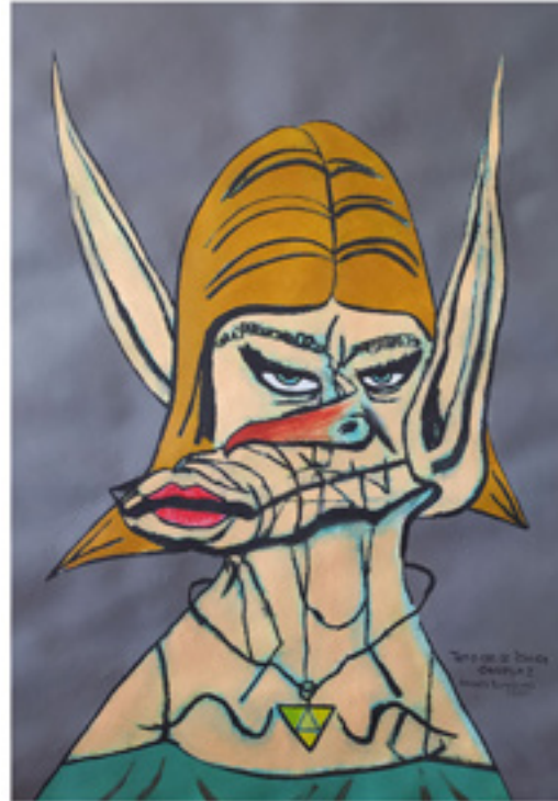
Andrej Bunuševac „Tamo gde se štakor okuplja 1”; 2020; akrilik i ugljen na akvarel papiru; 70 x 50 cm