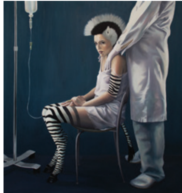
Jana Stojaković „Kliničko ispitivanje” 2020; ulje na platnu; 110 x 120 cm