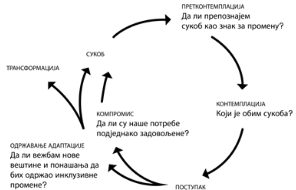
Jeff Kasper “Relaciona atletika: dijagram održavanja prilagođavanja” 2020