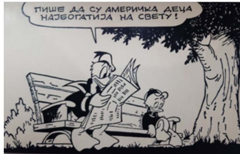
Uroš Đurić „Aproprijacije 8 / vest dana” 2018; ulje na platnu; 270 x 170 cm