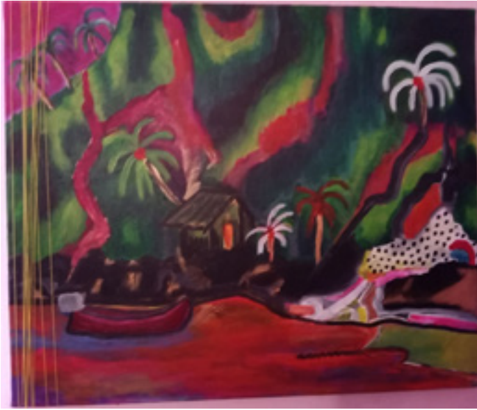
Jovana Braletić „Devojka i gepard” 2020; akril na platnu; 50 x 50 cm