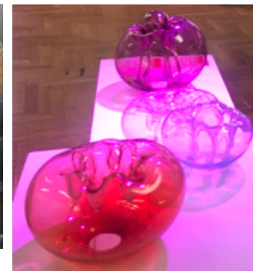
Pokret za očuvanje stakla Dragana Drobnjaka;