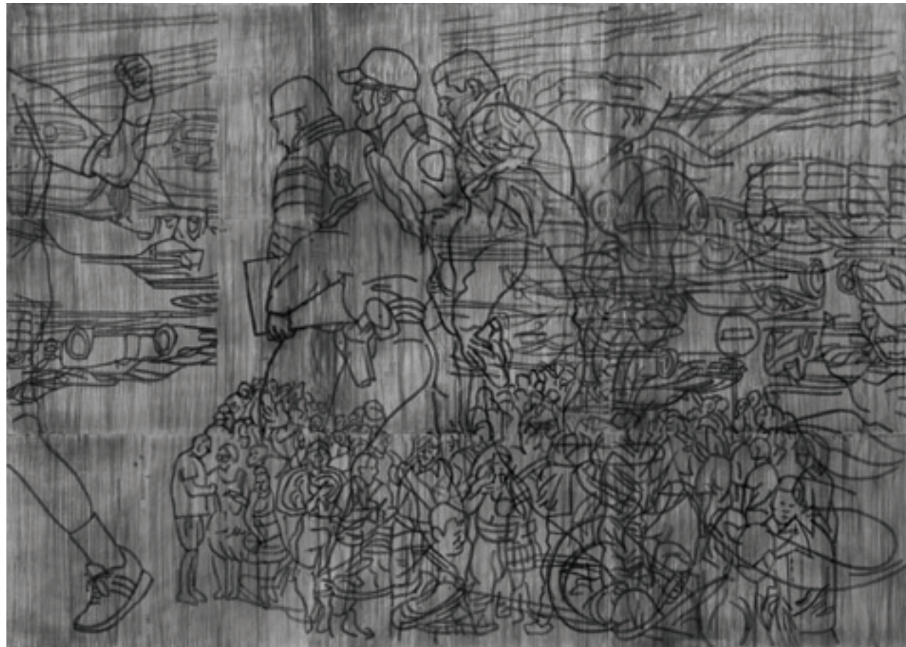
Vladimir Milanović „Bez naziva” 2020; crtež; 300 x 210 cm