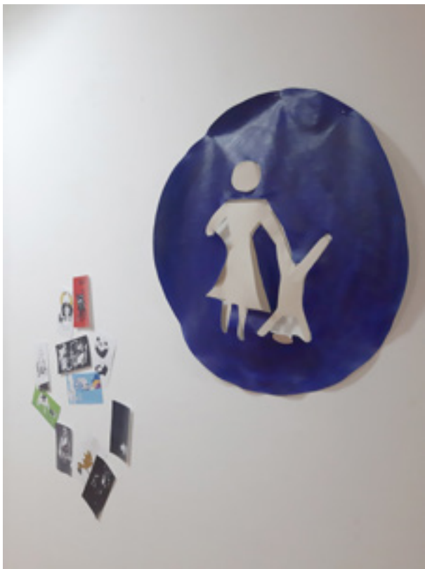
Jamezdin „Životinje pored puta” 2020; kombinovana tehnika