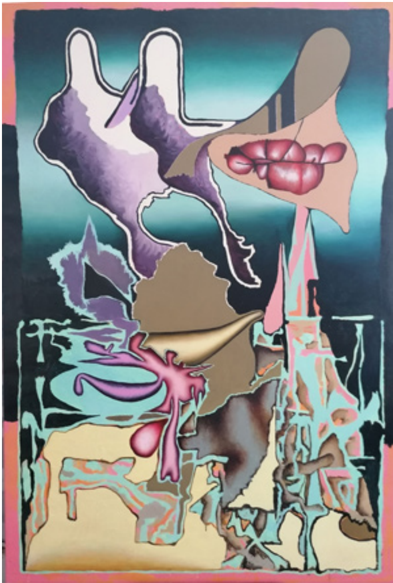
Ranko Travanj „Kancerogenost“ 2020; ulje na platnu; 150 x 100 cm