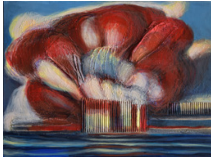
Anamarija Vartabedijan „#PrayforBeirut - Beirut Explosion 2020“ 2020; akrilik na platnu; 60 x 80 cm