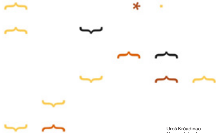
Uroš Krčadinac Nanogalebovi generativna animacija, 2020.

Ako mutacije utiču na naše sazajne procese, okolnosti 2020. su tim uticajima pridodale i transformaciju fizičkog aspekta umetničkog iskustva, a koja je uslovljena nebezbednim materijalnim prostorom i pokušajem preusmeravanja iskustva umetnosti na hiperkontrolisani digitalni prostor. U tekstu „Uspeti u teškim vremenima: napravite digitalni obrt“ 1 izneta je činjenica da je trogodišnja misija velikih kompanija o ubrzanju digitalizaciji ostvarena uz pomoć KOVID-19. Ali da li se ideal o tome da „sve bi trebalo da bude lakše, nezvisno od kanala, od situacije i lokacije“ može primeniti na instituciju umetnosti? Da li umetnost može da postoji nezavisno od ustanove i da li ustanova može da promoviše vrednosti nezavisno od kanala, situacije i lokacije? Misija umetničke ustanove u svojoj osnovi je da promoviše aktuelnosti, zastupa interese i kultiviše stav upletenih javnosti i publika, a ništa od toga nije moguće raditi sasvim izvan fizičkog okruženja, i ništa nije lakše zbog KOVID-19. Jesenja izložba: Upleteni , kao konstelacija umetničkih postupaka, ističe naglašeni značaj vizuelnog čulnog iskustva i mogućih načina na koji ono može biti instituisano. Bez obzira, ovogodišnjoj krizi ULUS se prilagodio organizovanjem niza on-line diskusija ( Jeff Kasper, Dushko Petrović, Paul O’neill, Michael Birchall, Hristina Mikić ), čime se priključio digitalnom obrtu.