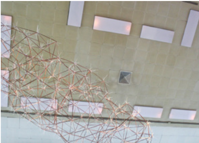
Ivana Milev „Meta” 2020; čelik i polivinil-hlorid