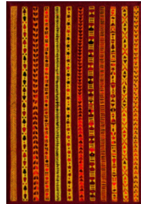
Ivana Jakšić „Hologram u zlatnom” 2019; ulje na platnu, lepljeni glitter