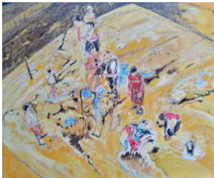
Miron Mutaović „Kopači” 2020; ulje na platnu; 50 x 60 cm