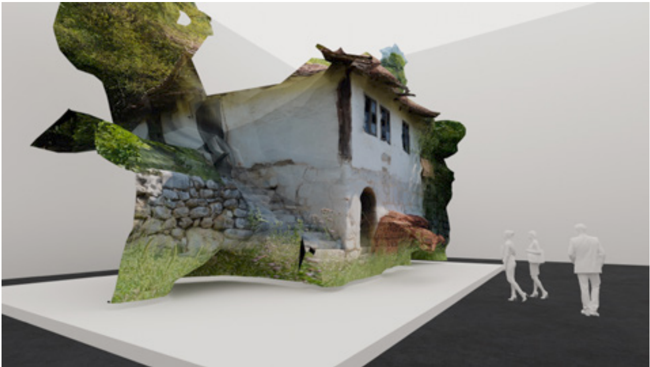
Nemanja Ladić „Muzej površnih zabeleški” 2019; video; 5 minuta