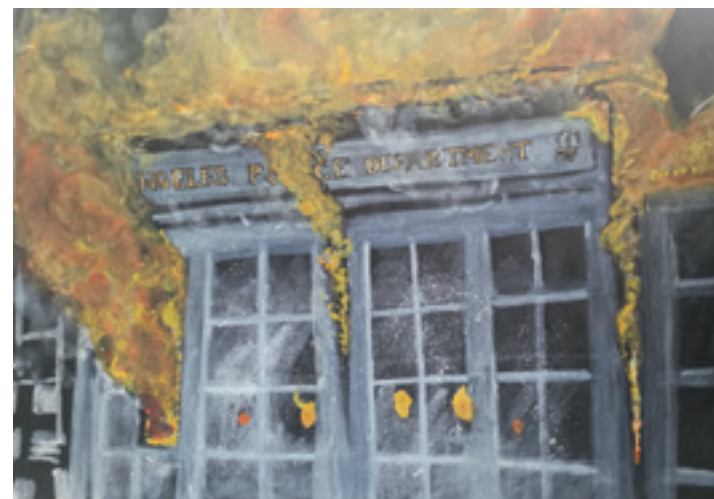
Milica Ružičić „Lepo gori LAPD“ 2020; akvarel; 71 x 50 cm