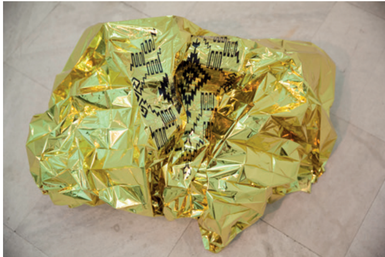
Ana Vujović „Do you feel safe enough?” 2016; termo čebe i print