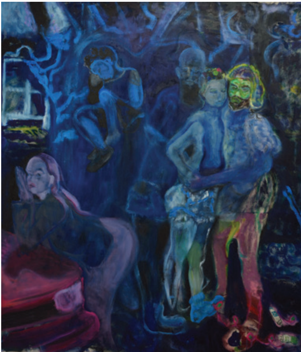
Nebojša Despotović „Le nozze” 2019; ulje na platnu; 163 x 145 cm