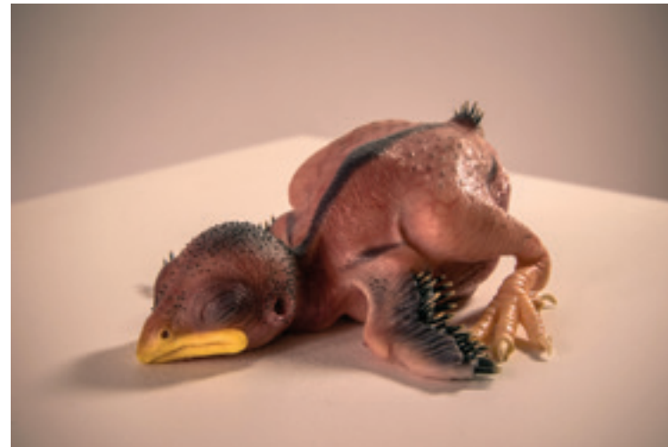
Nenad Gajić „Jedan trenutak” 2019; objekat