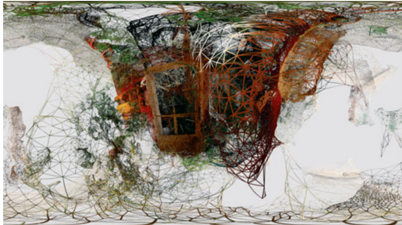
Nataša Teoflović „autobiografija / tišina” 2019; 3D animacija; 2 minuta