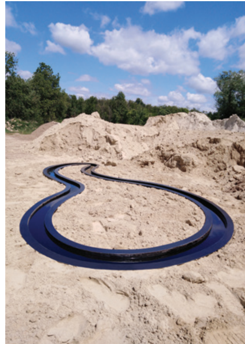
Dragan Rajšić „Tok” 2017; skulptura; 420 x 230 x 10 cm