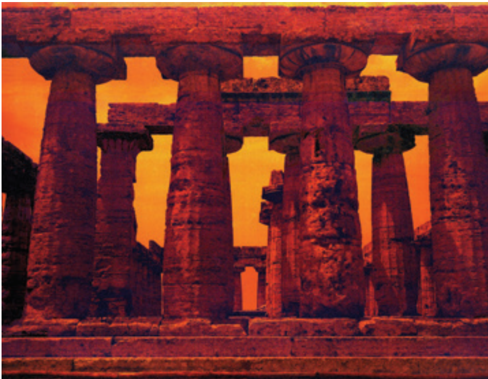
Đorđe Odanović „RGB Pestum 1” 2020; fotografija i mastilo na platnu; 110 x 135 cm