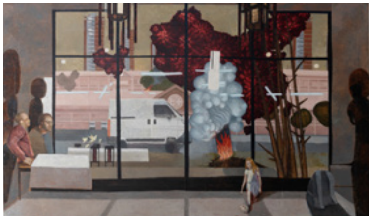
Nikola Marković „Chinatown 1” 2019; ulje na platnu; 200 x 300 cm