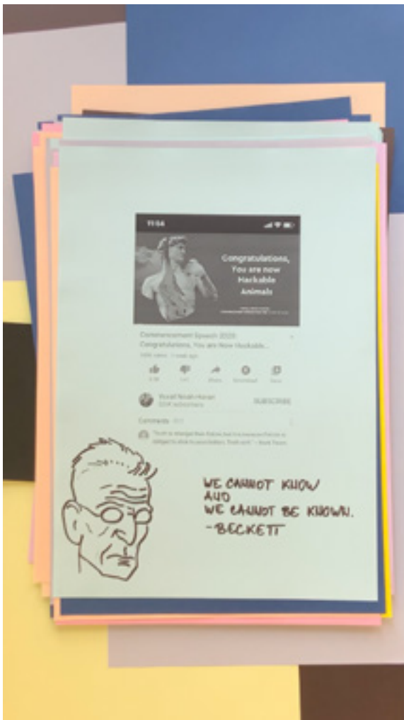
Igor Simić „Instant but distant” 2020; video 15 minuta