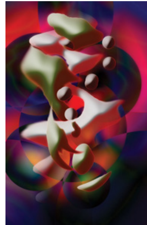
Nenad Vučković „Tok dobrih vrednosti - R-A-D-O-S-T“ 2019; kolaž - digitalna štampa; 70 x 200 cm