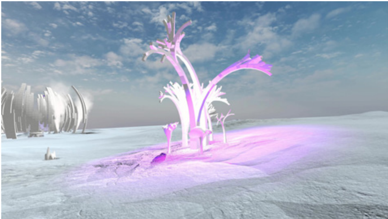
Tatjana Tanja Vujinović „Plazmonika” 2020; video dokumentacija rada u virtuelnoj realnosti