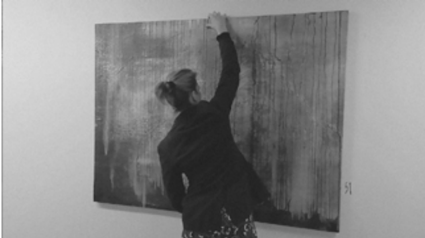
Nina Radoičić „Neutralpreference“ 2020; performans i uljane boje i pigmenti na platnu; 160 x 120 cm