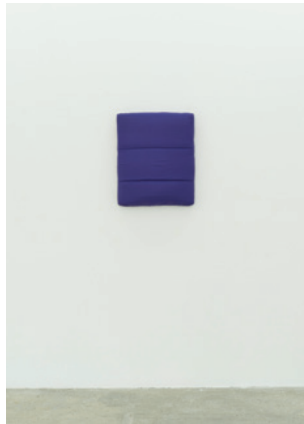
Ksenija Jovišević „Mont br. 9” 2019; Mont jakna na platnu; 60 x 50 x 4 cm