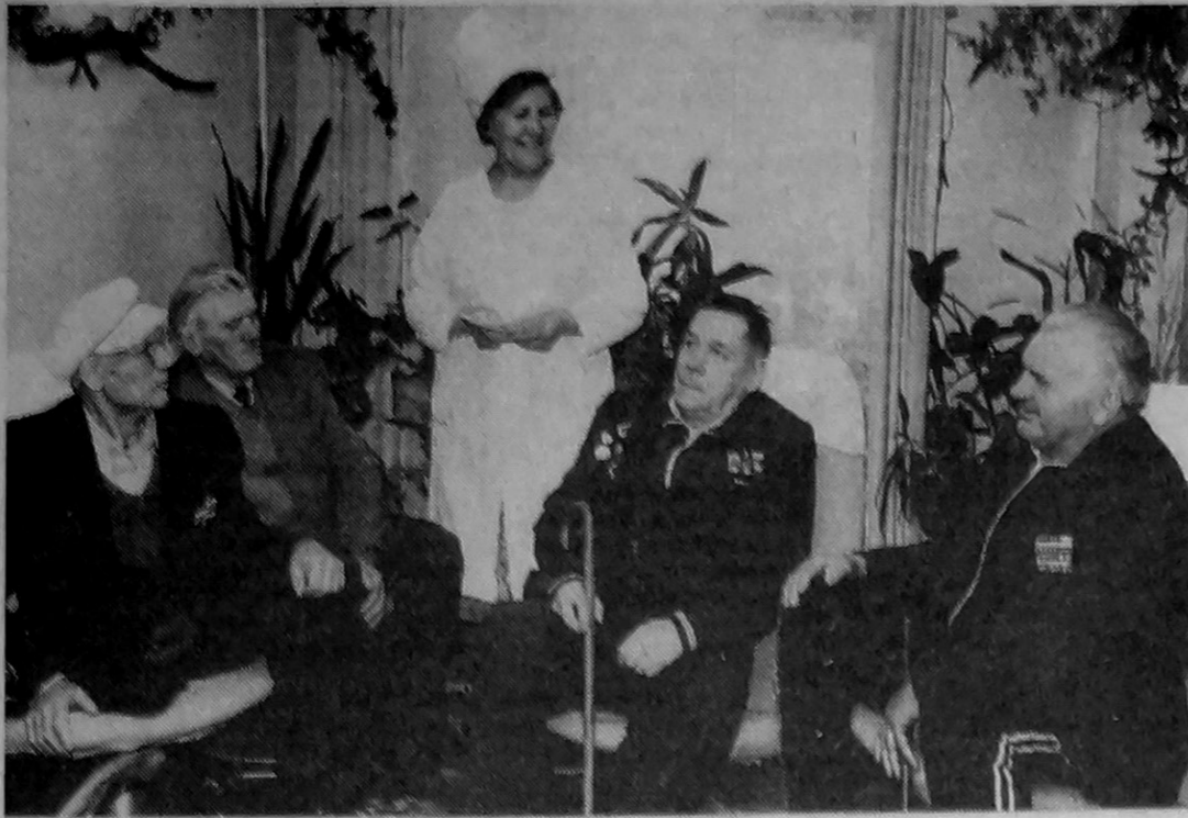
Алушта. Санаторій «Ветеран». З усіх кінців України набираються тут здоров'я учасники Великої Вітчизняної війни.