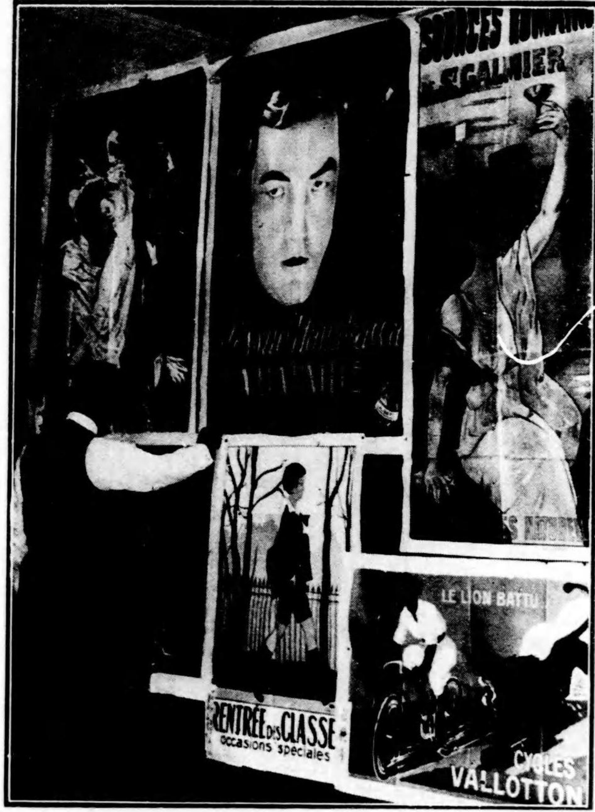
ポスター展覧會陳列場 佛蘭西ノ部