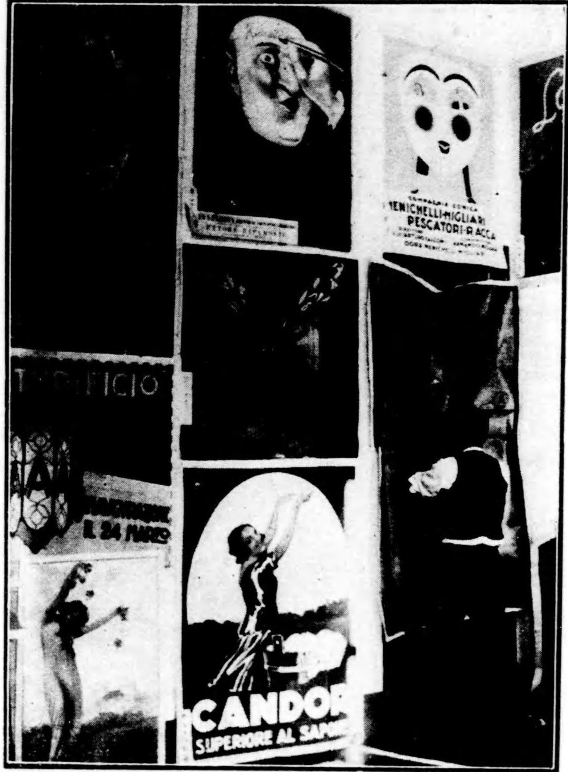
ポスター展覽會陳列場 伊太利ノ部