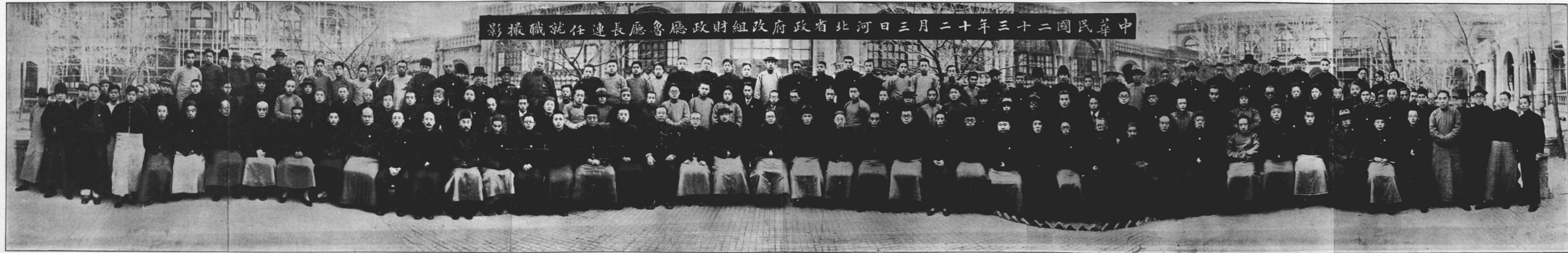
中華民國二十三年三月二十日河北省政府財政廳廳長任職攝影