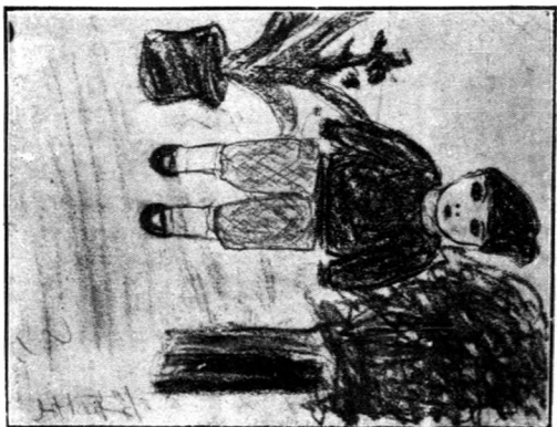
一 東 十 歲