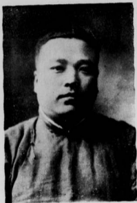
新 日 湯 長 縣