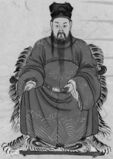
燉煌郡斌卿公遺像