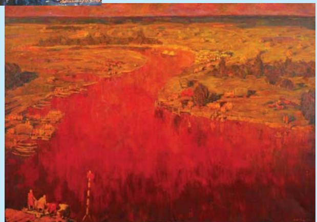
Картина "Земля Мезинська"

Тут ранок зливається з морем, Тут море зливається з ранком І в часі уже не повториш Цей дивний сюжет на світанку. Де квіти задивлені в небо, Де небо на хвилі лягає І світла надія для тебе Свій парус легкий напинає.