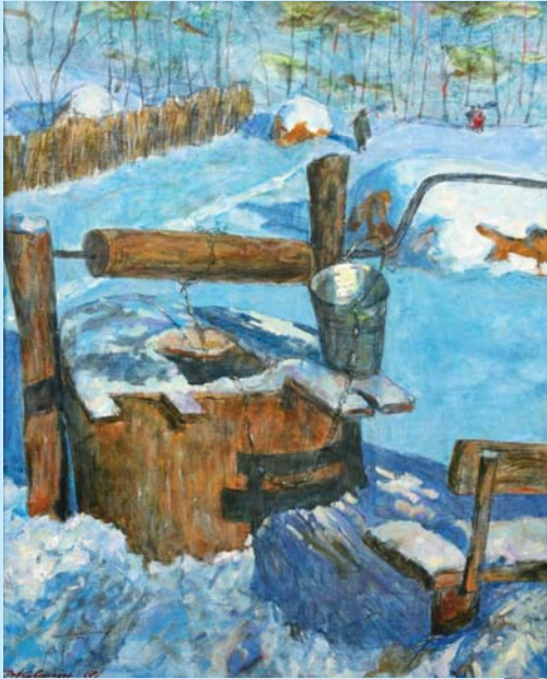
Картина "Зимова криниця"

Як схочете свяченої води – Прийдіть сюди, до нашої криниці. Її вода мені і досі сниться, Я пам'ятаю смак її завжди. Тут просто все – нема нічого зайвого, Бо зайве все – за вітром відліта, І рано-вранці тут вода незаймана Її для чистих серцем – ця вода свята.