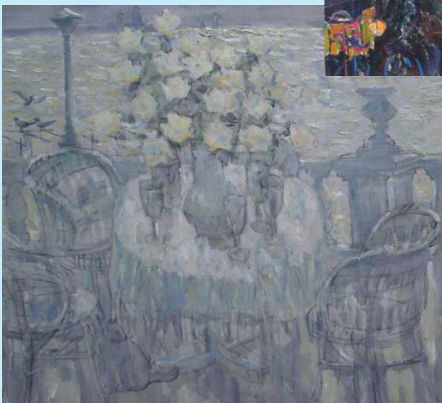
Картина "Ялтинське кафе"

В тобі твій храм, і ти його несеш Туди, де впали ангели любові, Туди, де відчай добігає меж, Де ницістю підточені основи, Бо тільки ти, твій невмирущий дух, Добуде іскру, що освітить мури І чисті дзвони наш розбудять слух, Й народять дня нового партитуру.