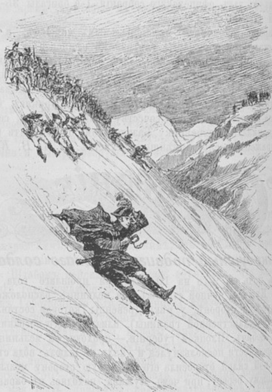
Къ статьѣ «Находчивость Массены».

«Массена, карабкаясь по крутому склону, одинъ направляется къ несчастному баталіону, добирается, наконецъ, до него, обращается съ нѣсколькими словами къ людямъ и обѣщаетъ вывести ихъ изъ затруднительнаго положенія, если они послѣдуютъ его примѣру. Онъ приказываетъ отомкнуть штыки и вложить ихъ въ ножны, самъ садится въ свѣтъ на край обрыва и, отталкиваясь руками, скатывается въ до-