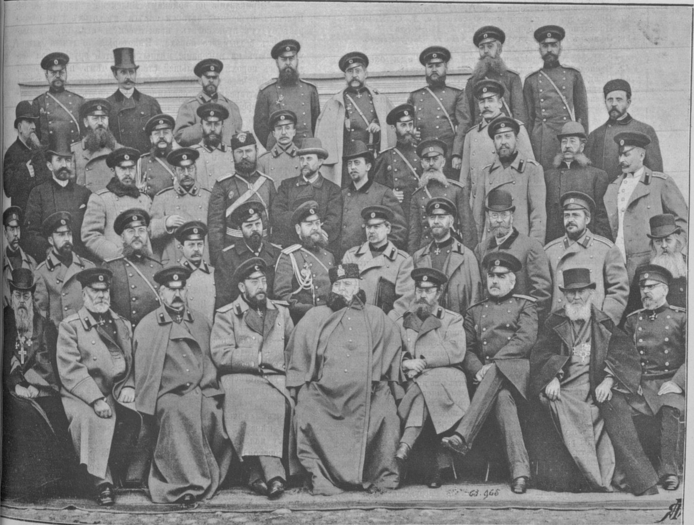
Строевой и учебный составъ Михайловской артил. академіи и училища. (Съ фотографіи братьевъ de Jongh).