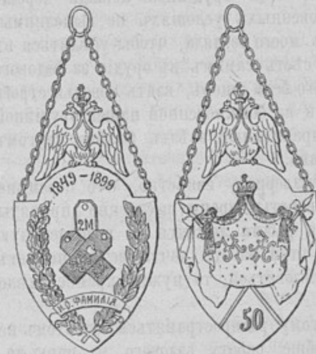
Жетонъ 2-го Московскаго Императора Николая I кадетскаго корпуса.

По краямъ щита: зеленого золота накладной лавровый вѣнокъ съ лентой и на ней имя, отчество и фамилія владельца жетона; въ срединѣ три эмалированные погона, бѣлый и синій;