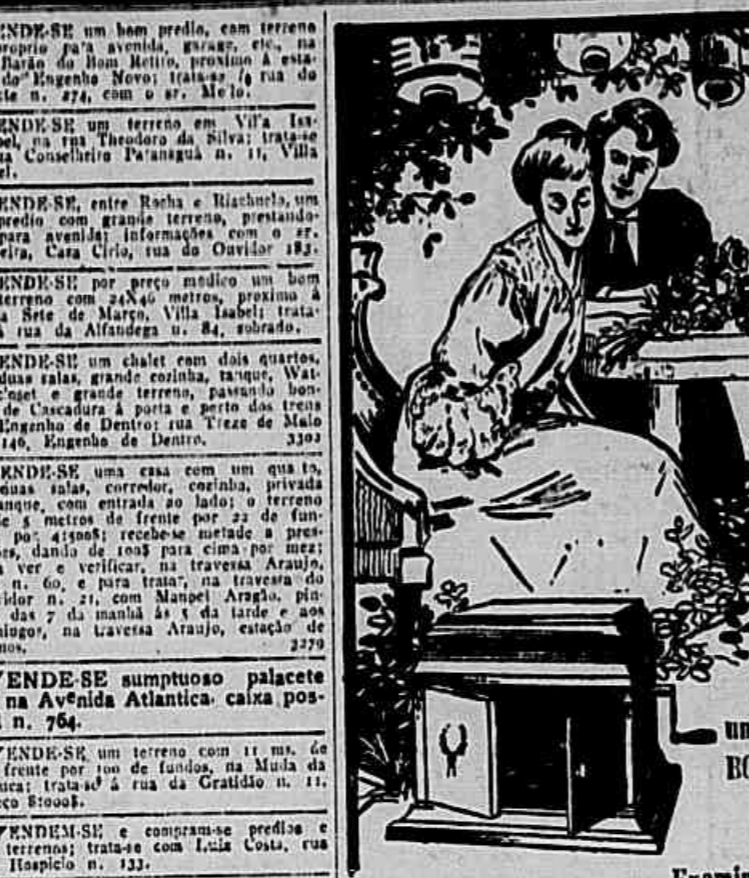
Examina a Victrola FORTEPHONE por 100$ é uma revelação.

VENDE-SE um terreno em Vila Isabel, na rua Theodoro de Silva, n. 11, Vila Isabel, n. 11, com ar. de M. L. M.