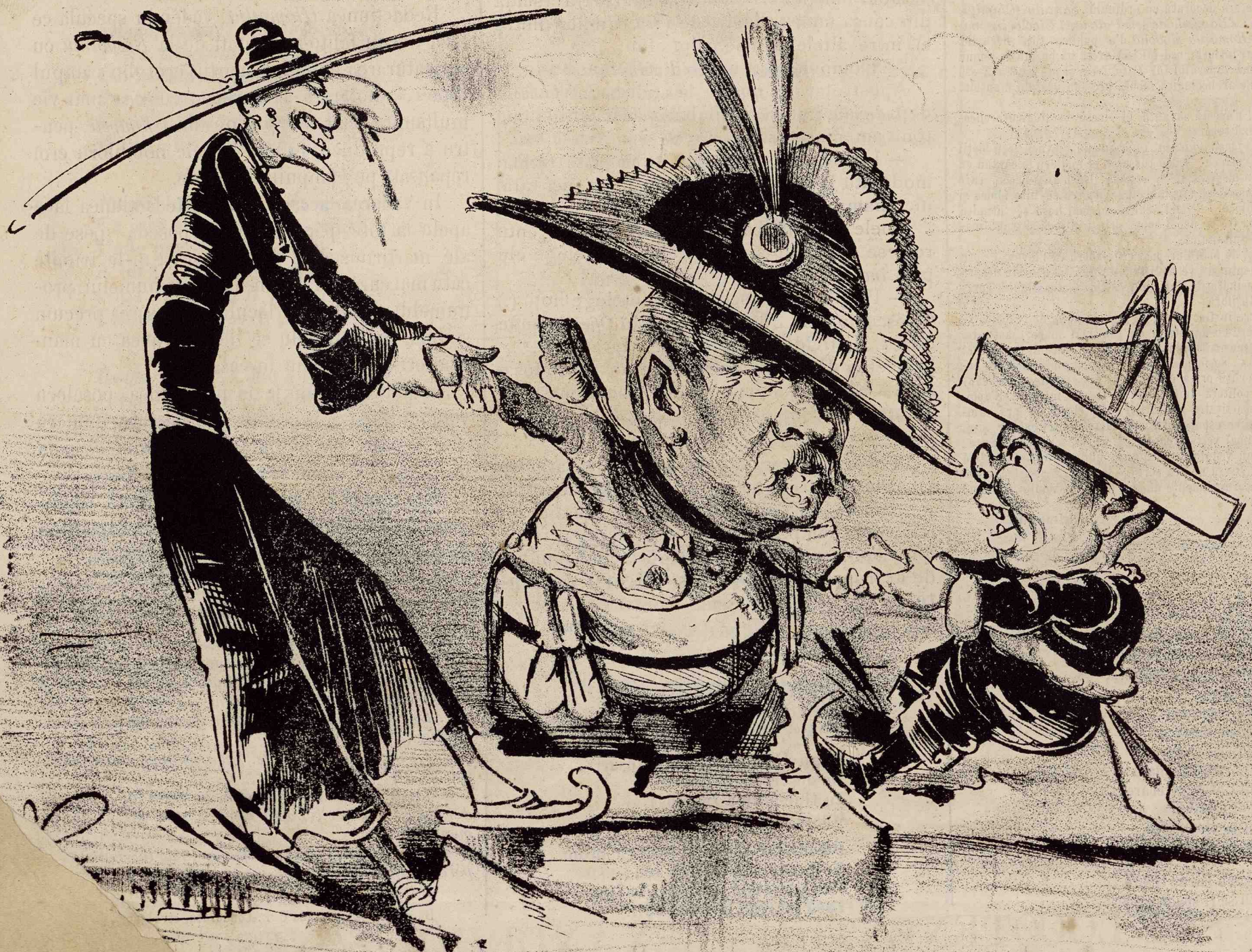
nici vrând să scape pe Mac-manșon din capcă, se vor afunda cu toții de vultórea poporului.