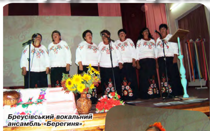
Бреусівський вокальний ансамбль «Берегиня»

Порадували слух і зір численних учасників свята і гості з навколишніх сіл — Сушків і Пригарівки, Рибалок і Чапаєвки. Вокальний ансамбль гостей гармонійно вплелися у канву усієї святкової програми, доповнили і збагатили її, принесли невимовну насолоду глядачам.