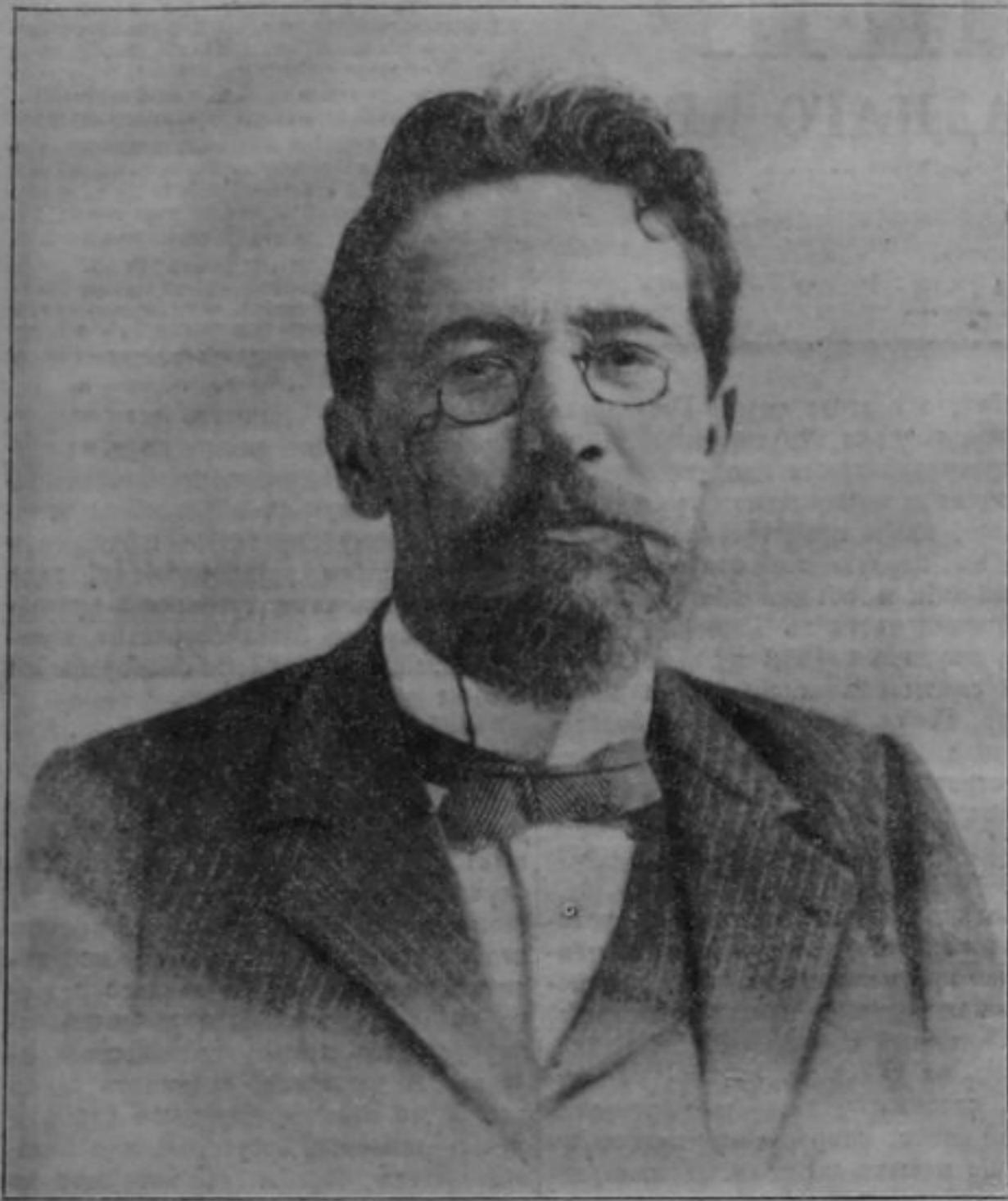
Антон Павлович Чехов, 1904 г. — 2 июля — 1914 г.

Несмотря на то, что празднование пятидесятилетия юбилея «Киевланина» отложено на 1 января 1915 года, нами все-же получено несколько пригласительных телеграмм. Редакция «Киевланина» приносит искреннюю благодарность за эти сердечные слова и добрые пожелания.