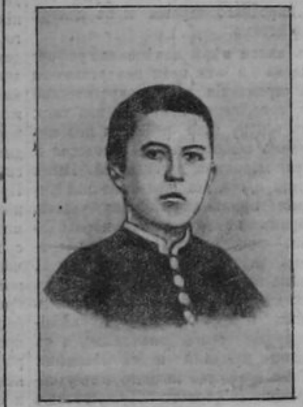
А. П. Чехов в 1874 г.

А. П. Чехов родился 17 января 1860 года в Таганроге. Дядя его, в молодости откупившийся на войну, служил в богатой семье. Отец А. П., женившись на купеческой дочери, открыл в Таганроге бакалейную торговлю. Был он человек легатный, знал, какую пользу может принести человеку образование и рьяно шел его диктат. Между тем приходилось ему, в сущности говоря, очень туго. Торговля шла скверно, достатков не было почти никаких, ютились всею семьей в маленьком почти развалившемся домике, состоявшем из трех комнат-каблучков. В середине семидесятых годов прошлого столетия была проведена желательная дорога из Ростова-на-Дону во Владикавказ и это сильно уронило в торговом отношении Таганрог. Оборота родного города А. П. перешел в соседний Ростов и дядя отца его сильно разорился. Перевел он свою торговлю в иное место, начал было строить дом в преддверии и дядя его оговорачивал пошатнулся. Несмотря на все эти бедствия, А. П. был отдал раньше в трехклассную школу при церкви царя Константина, а потом поступил в местную гимназию, которую и окончил в 1879 г.