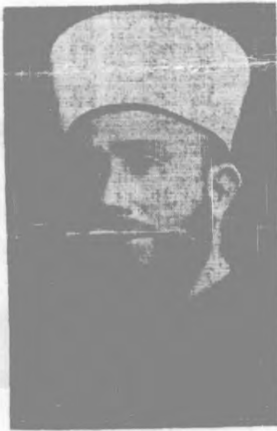
巴力士丁事仲中同族領袖之一 穆夫德爾侯尼氏

صاحب السماحة الحاج محمد أمين الحسيني مفتي اكير بالقدس