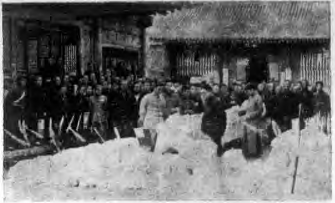
咸陽縣合作社聯合社舉行棉產展覽會