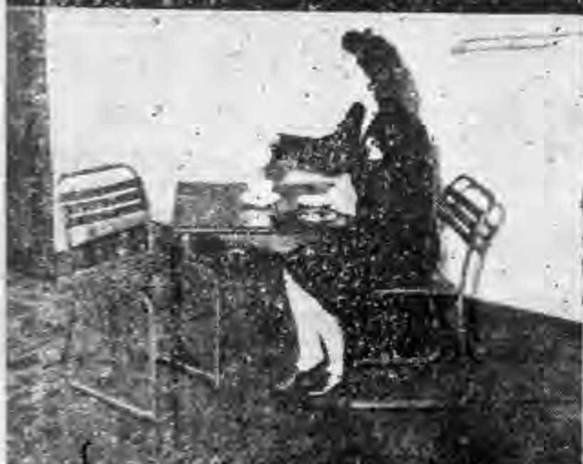
1. 英國最新出品，以玻璃板 裝在克羅米鋼椅架上