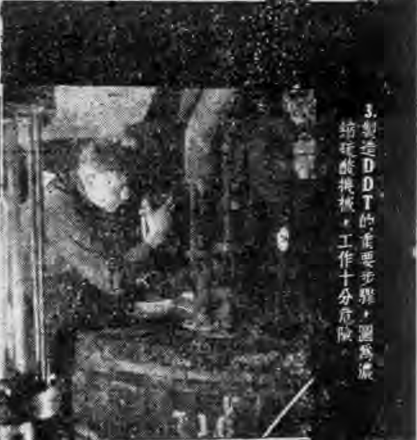
3. 製造 DDT 的重要步驟，圖為廣 縮硫酸機板，工作十分危險