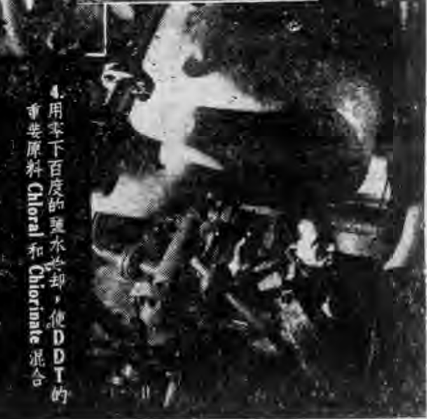
4. 用零下百度的鹽水冷却，使 DDT 的 重要原料 Chloral 和 Chlorinate 混合