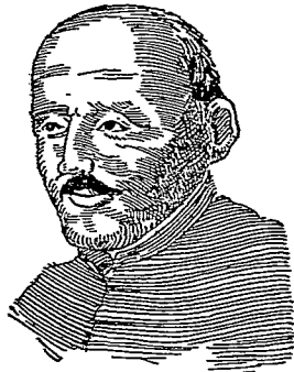
像 拉 耀 羅

宗教戰爭 宗教戰爭的遠因，由於日耳曼諸侯所建立新舊教同盟的對壘，雖日耳曼皇帝曾允許信教自由，(四) 但亦不能消弭新舊教的鬭爭。戰爭的近因，由於波希米亞 (Bohemia) 地方新舊教徒的鬭爭，日耳曼皇帝壓迫新教