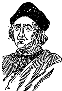
像 布 倫 哥

手有見難思回的意思，他堅決前行，竟發現 聖薩爾瓦多爾 (San Salvador)，他以爲這就是 印度 。不久又發現 古巴島 (Cuba)，他以爲這就是 亞洲 的地方。