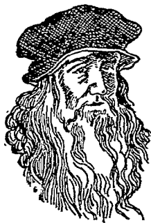
像 奇 芬