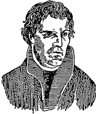
路 德 像

新教的興起 基督教的 第一位改革家 ，便是 馬丁路德 (Martin Luther)。他本是一個修道士，後來任 薩克森侯國中威丁堡 (Wittenberg) 大學的神學教授。他曾游歷羅馬，目覩教會的腐敗，深覺有改革的必要。及見教皇發售贖罪券，他便大膽的於一五一七年發意見書九十五條，指摘教皇舉動的錯誤。羅馬教皇大怒，於一五二〇年下令把他驅逐出教，路德把教皇命令當眾燒燬。日耳曼皇帝 查理第五 (Charles V) 因教皇的請求，在 窩姆斯 (Worms) 地方召集大會，命路德前往，路德始終不屈。後來他更將希臘原文聖經，譯成日耳曼的方言。可是他的這種宗教革命，為