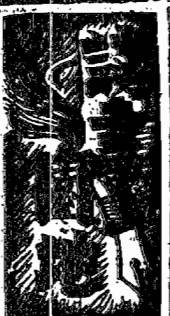
獻給時代的現代婦女們