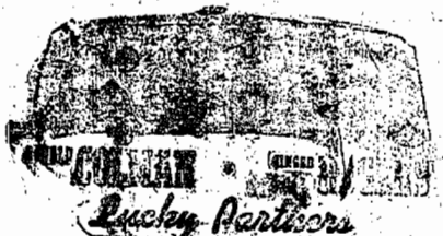
米高梅公司最新到名畫片