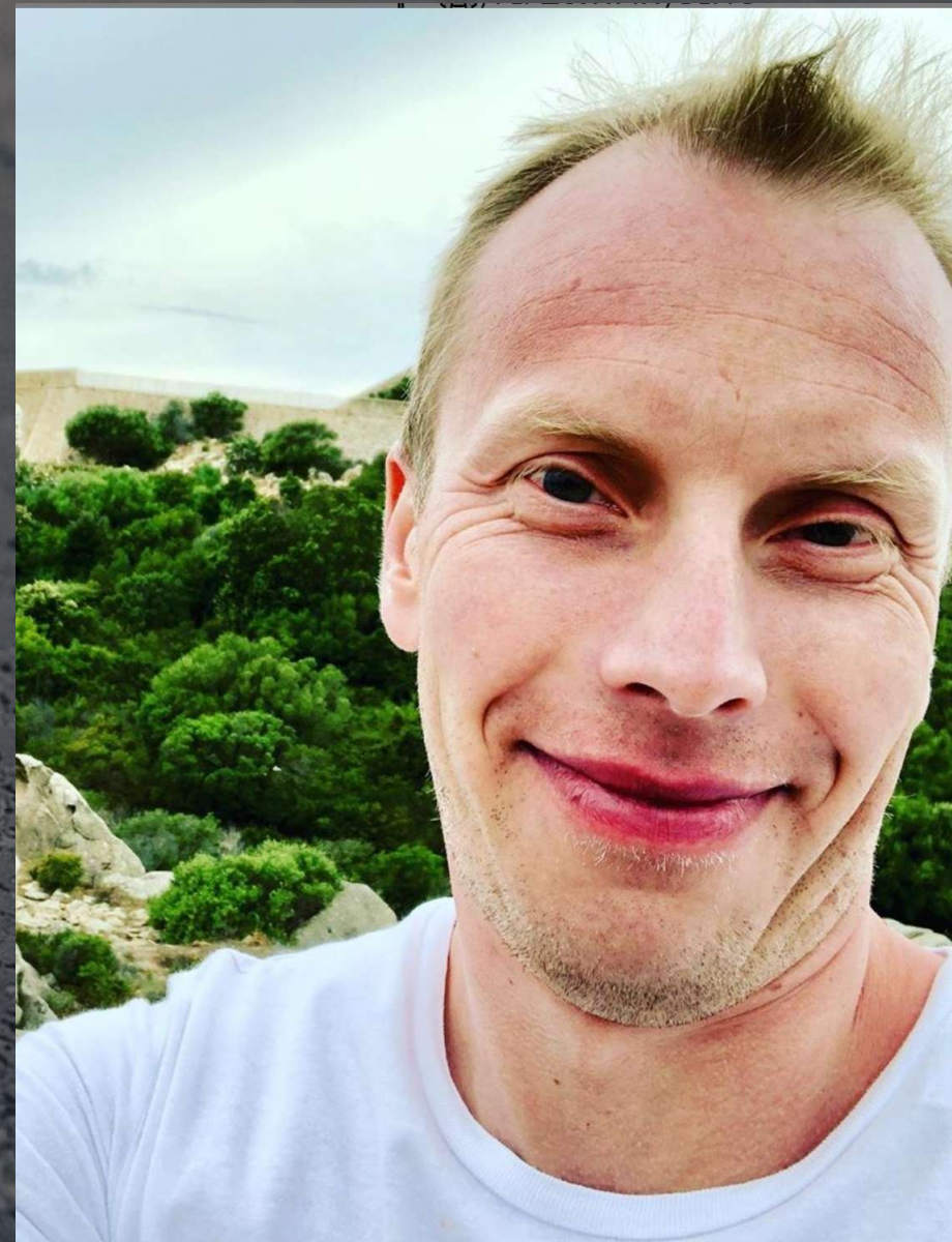
Leszek Dobrowolski, CC-BY-SA-4.0