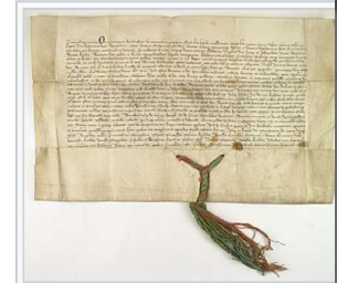
Kazimierz III Wielki , król polski, pozwala sprzedać wójtostwo w Kaliszu (1360 r.)