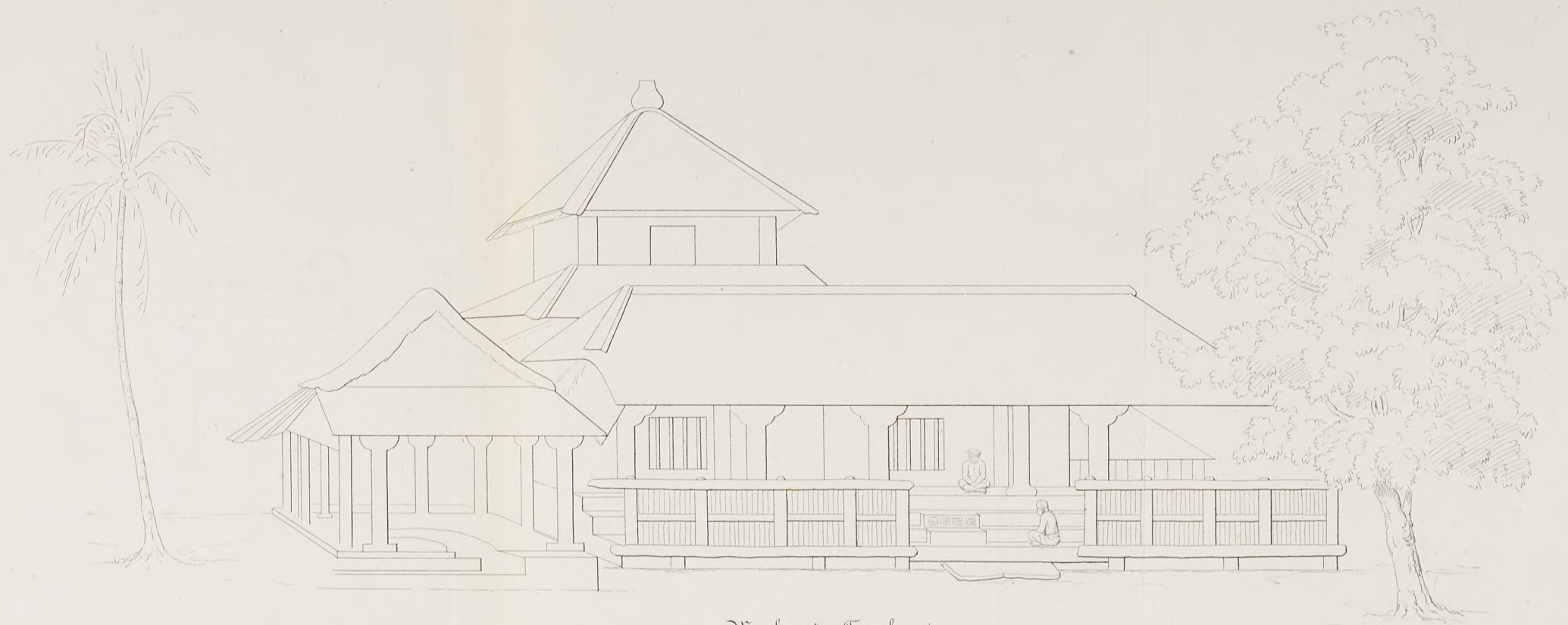
Moskee te Tegalsari.