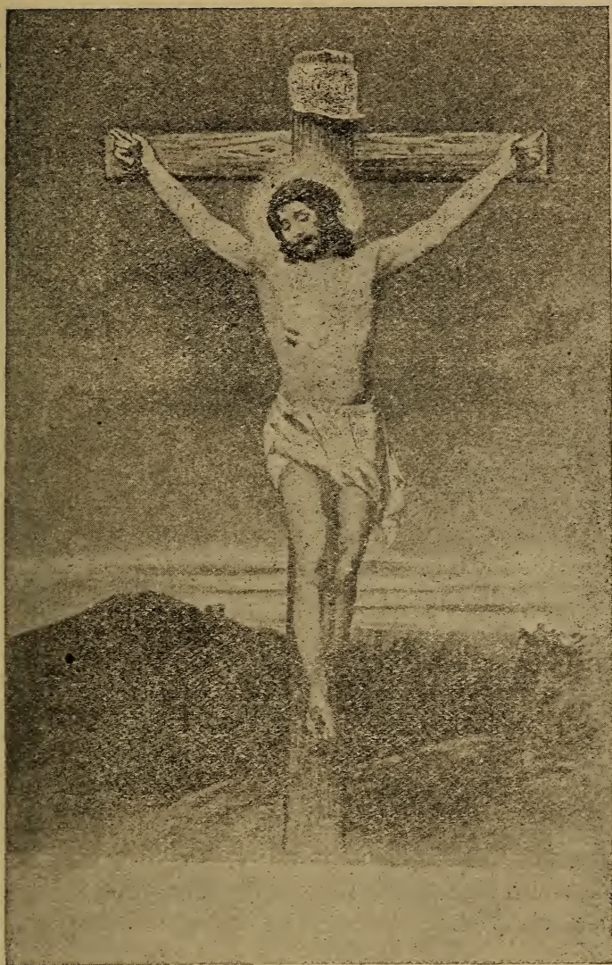
KRYQESIMI I KRISHTIT