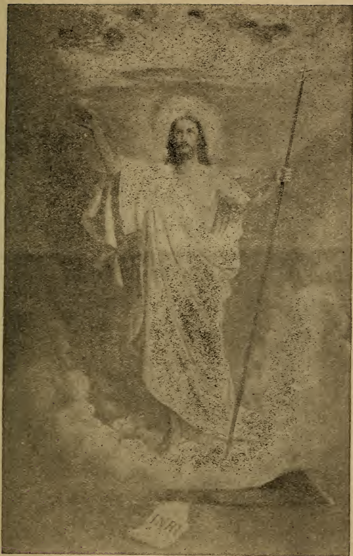
NGJALLJA E KRISHTIT