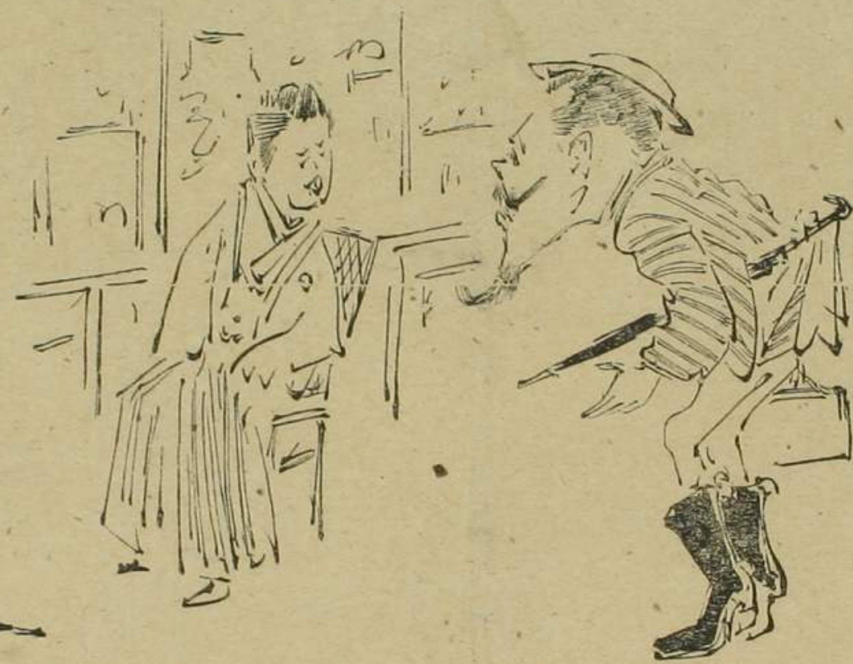
七 ちびつら 「こまの 八千円」