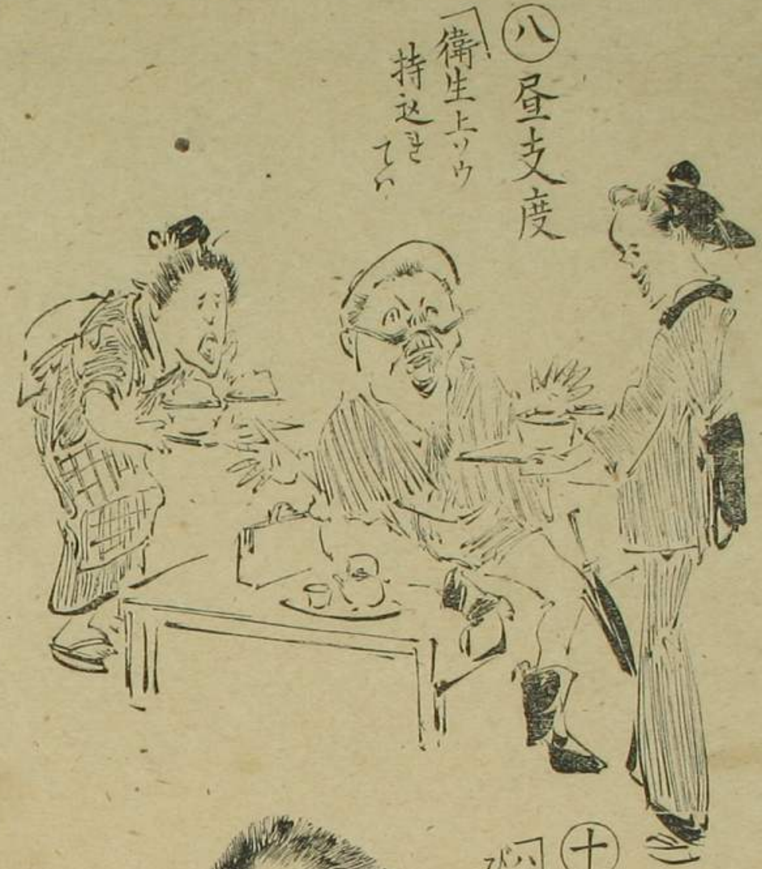
八 昼支度 「衛生上ウ 持込 てい」