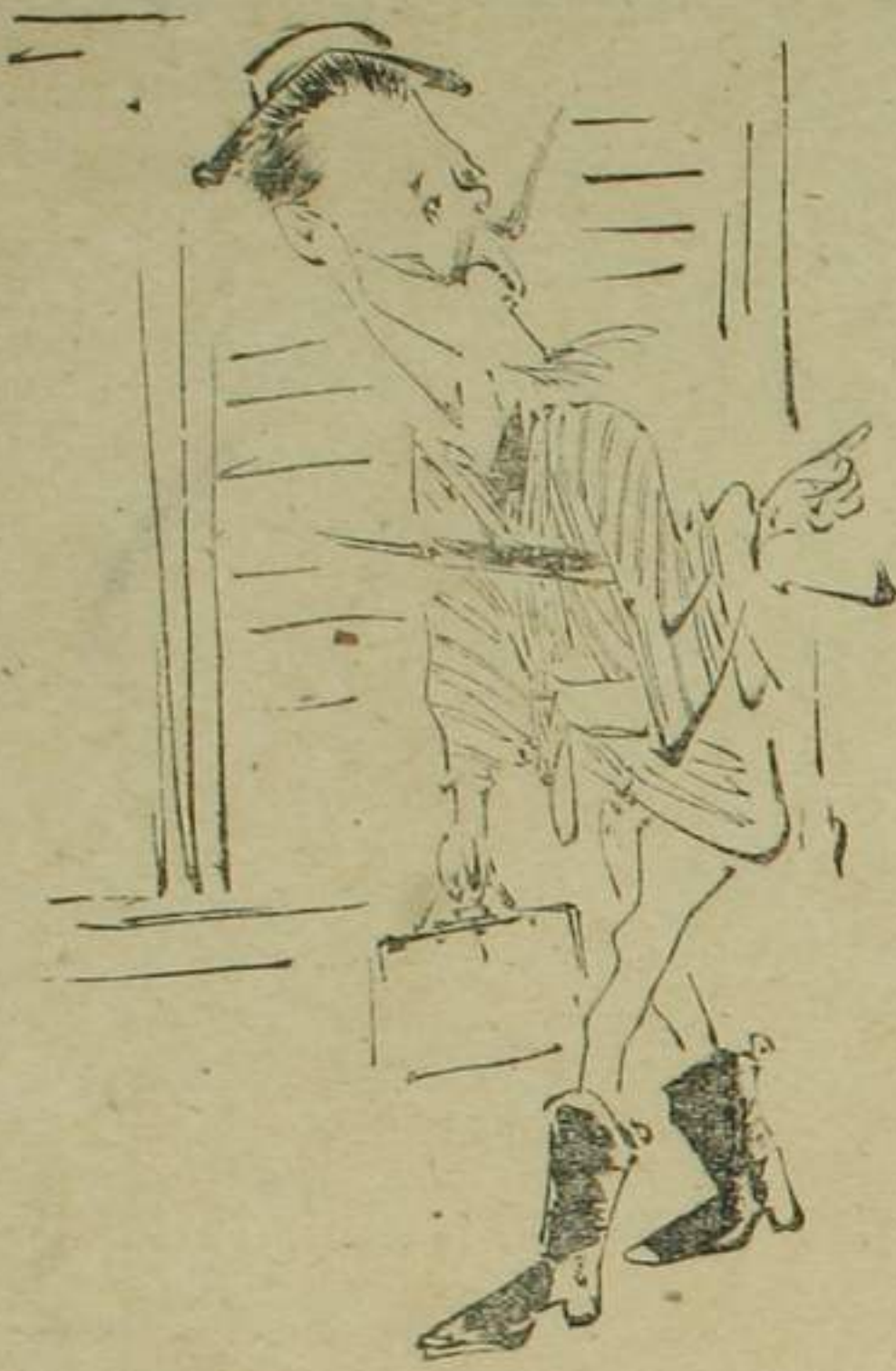
六 ちびつら 「又しても 元の所」