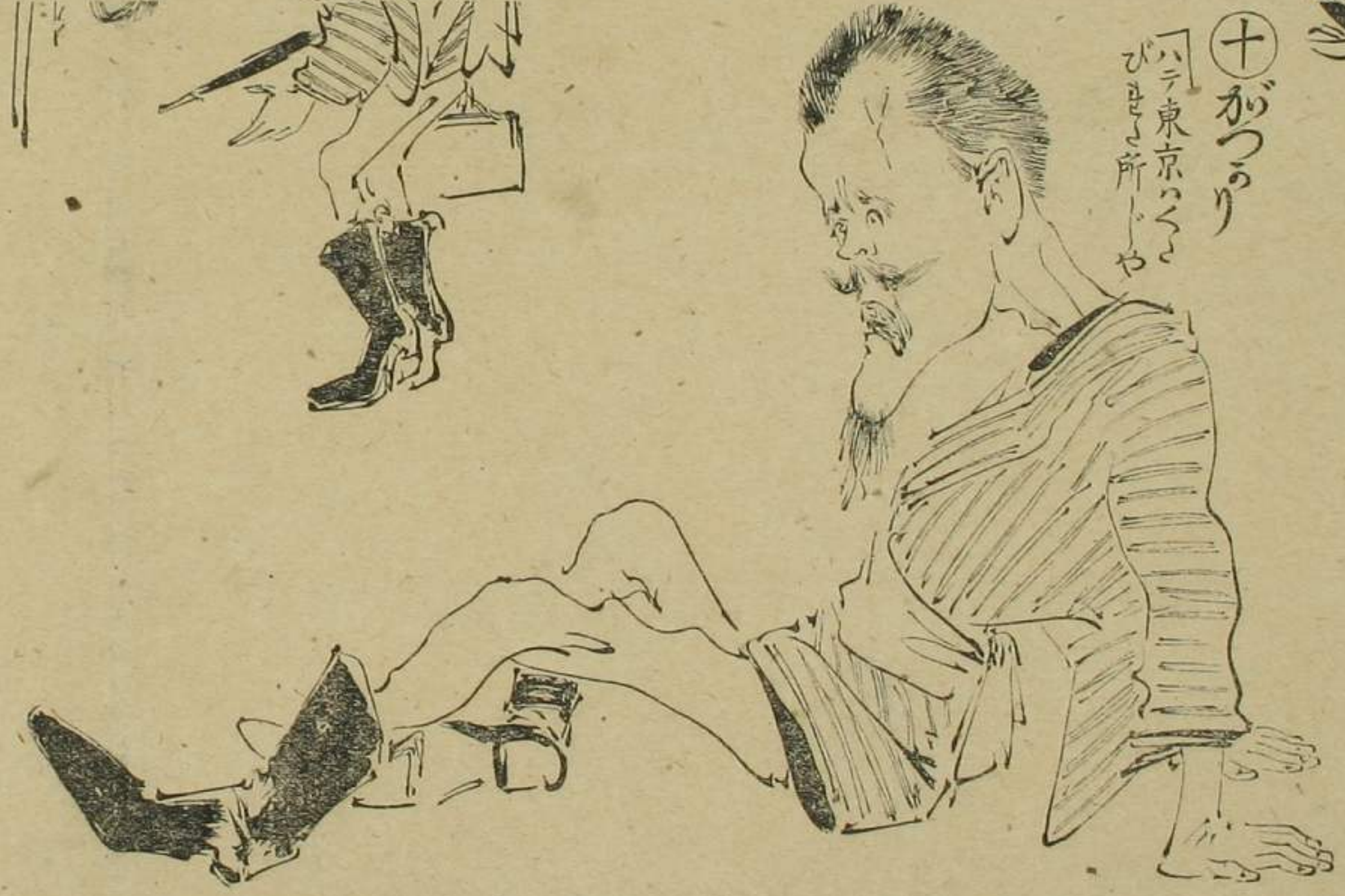
十 かつり 「ハ東京ウ びきり所 や」