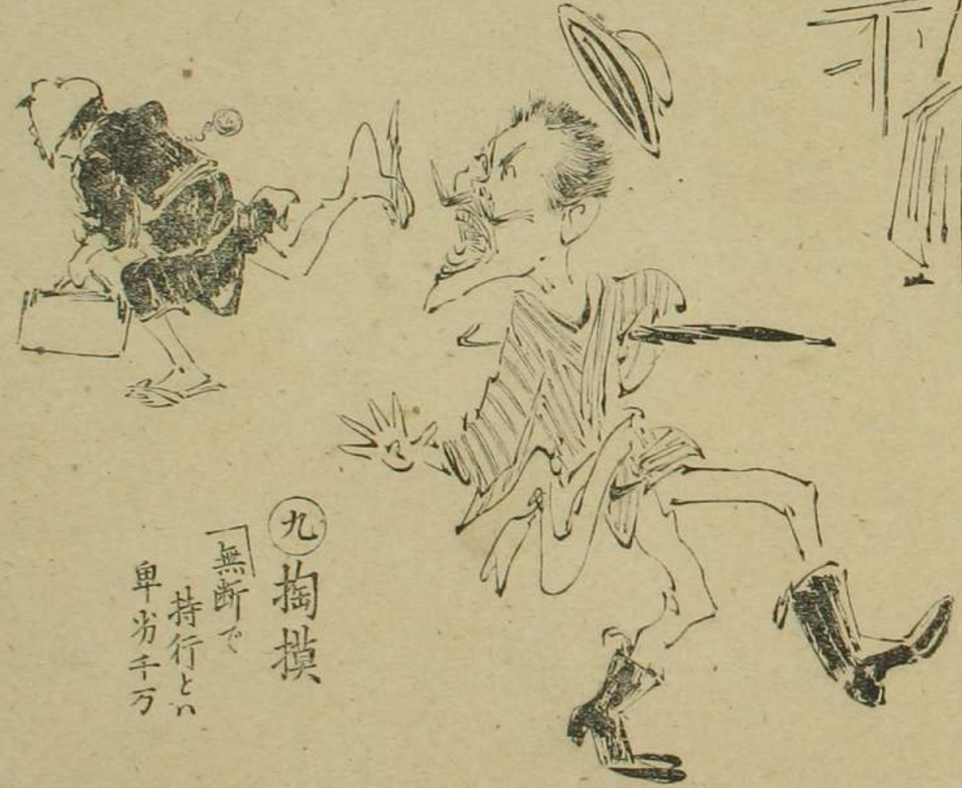
九 掏摸 「無断で 持行とい 卑劣千両」