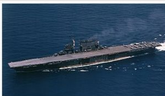
Kapal induk USS Saratoga .

USS Hazelwood nyaéta kapal pangancur kelas fletcher era Perang Dunya II dina layanan ti Angkatan Sagara Amérika Sarikat .