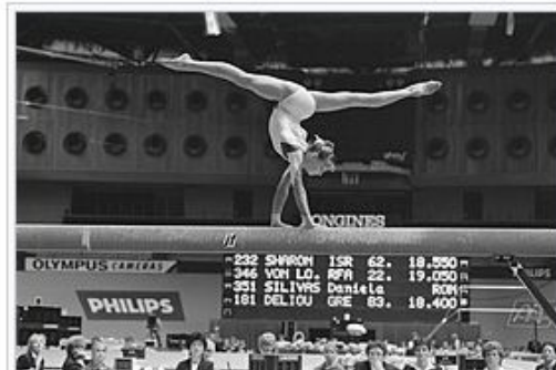
Daniela Silivaş pentas di papan titian dalam Kejuaraan Dunia 1987 📄