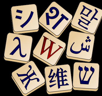
Wiktionnaire Le dictionnaire libre