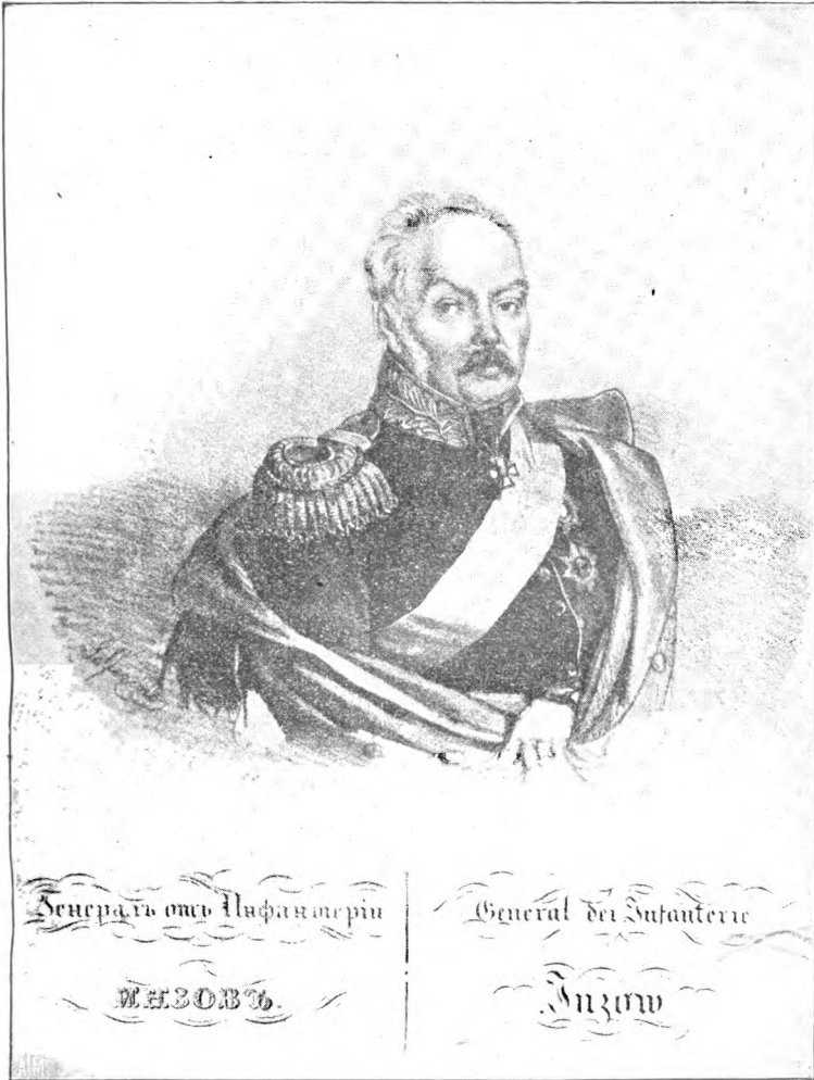
ИВАНЪ НИКИТИЧЪ ИНЗОВЪ.