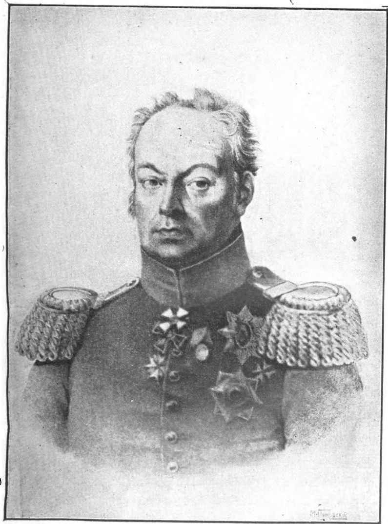
Иванъ Никитичъ ИНЗОВЪ.