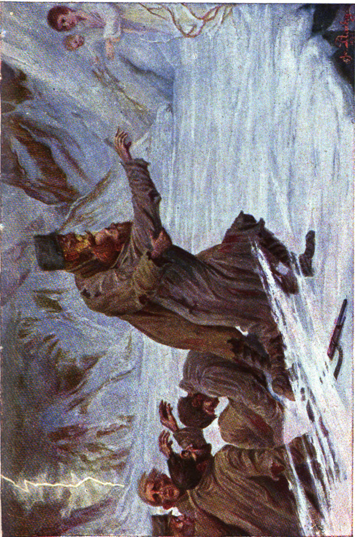
Так, так, це жінка з дитиною, Вона спасе всіх нас від смерті! (Пова мсжами болю.)