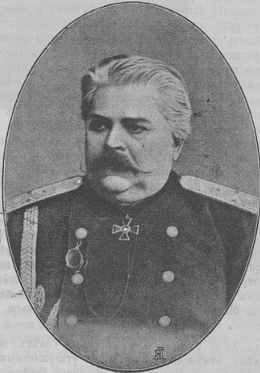
Начальникъ 9-й кавалерійской дивизіи, Генералъ-Лейтенантъ

Родился въ 1830 году. Воспитывался въ Николаевскомъ инженерномъ училищѣ; произведенъ въ офицеры въ 1849 году; окончилъ курсъ въ Николаевской инженерной академіи и выпущенъ въ 1851 году поручикомъ въ военные инженеры съ оставленіемъ при инженерномъ училищѣ репетиторомъ по строительному искусству; въ 1853 году утвержденъ преподавателемъ этого предмета; въ концѣ 1855 года назначенъ въ комиссію по укрѣпленію Кронштадта; въ январѣ 1856 г. назначенъ адъютантомъ къ Его Имп. Выс. покойному генералъ-инспектору по инженерной части. Въ томъ же году командированъ за границу въ Германію и Францію. Числясь по л.-гв. Саперному баталіону, произведенъ въ полковники въ 1863 г. Въ 1866 г. назначенъ командиромъ 129 пѣх. Бессарабскаго полка. Въ 1868 г., состоя по Военному Министерству, назначенъ членомъ бывшаго Главнаго Комитета по устройству и образованію войскъ, оставаясь его членомъ до 1875 г. Въ 1872 г. переведенъ опять въ военные инженеры и состоялъ при Главномъ Инженерномъ Управленіи.