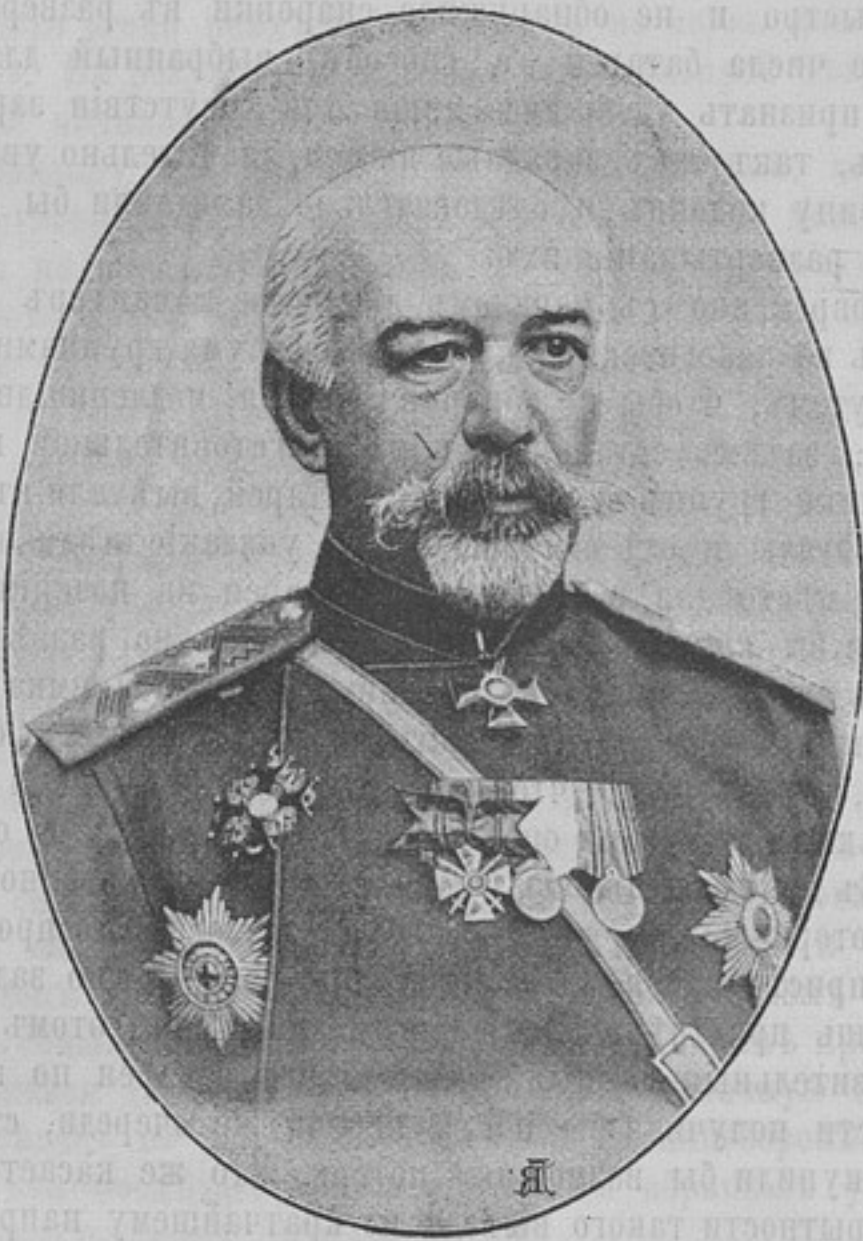
Командантъ Ковенской крѣпости, Генералъ-Лейтенантъ