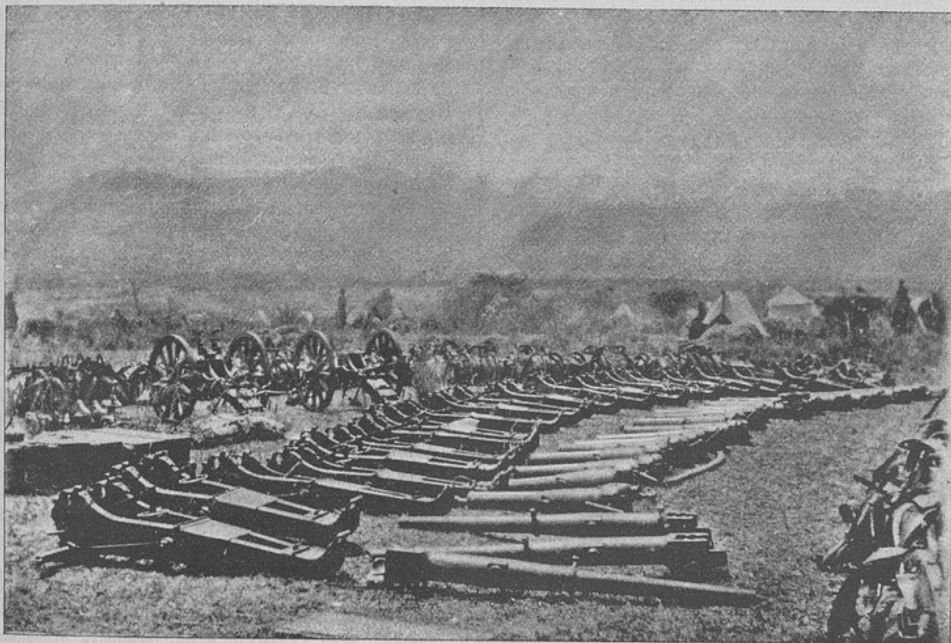
Италянскія орудія, взятая въ бою при Адуа (къ рецензій «Императоръ Менеликъ и война его съ Италией»).

«Вѣроятно, говоритъ онъ, объясняется это исторіей нашихъ многочисленныхъ войнъ съ турками, татарами и другими азіатскими народами, съ которыми намъ по преимуществу приходилось имѣть дѣло; но въ случаѣ войны на западѣ, въ странахъ культурныхъ, снаряженіе, приуроченное на худшій случай, т. е. къ пустынь, можетъ послужить сильнымъ тормозомъ нашихъ операцій».