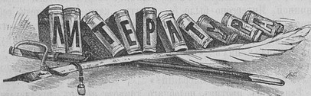
Пушкинъ, какъ военный писатель.