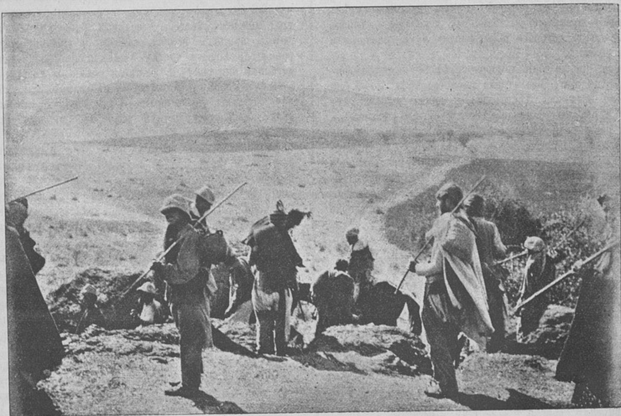
Италянскіе плѣнные на походѣ (къ рецензій «Императоръ Менеликъ и война его съ Италіей»).

Забота о всевозможныхъ починкахъ и задѣлкахъ въ ложахъ, конечно, даетъ возможность сохранить войскамъ незначительный процентъ ихъ, но въ то же время войска теряютъ огромный процентъ ложъ съ такими трещинами, которыя требуютъ уже замѣны ихъ новыми ложами, что происходитъ вслѣдствіе малой способности ихъ сопротивляться дѣйствію влаги. Между тѣмъ, если бы ложи были пропитаны масломъ или выкрашены масляною краскою, то ложи были бы навсегда обезпечены отъ сырости, влаги, разбуханія и гніенія, а также отъ поводки и покоробливанія. Указываемая мною мѣра, во-первыхъ, предохранила бы ложи отъ трещинъ и раскалыванія, а во-вторыхъ, не было бы погнутыхъ ложею стволовъ, ко-