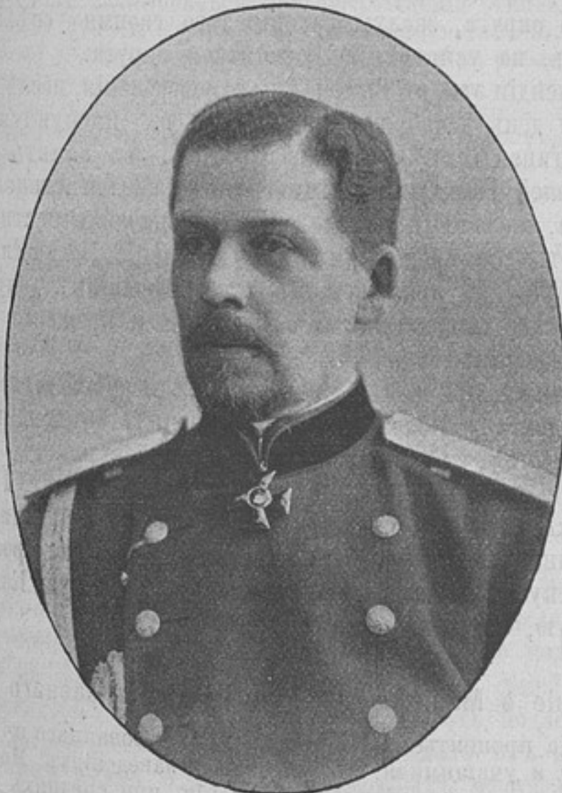
Начальникъ штаба отдѣльнаго корпуса жандармовъ, генеральнаго штаба генераль-маіоръ Дмитрій Петровичъ ЗУЕВЪ. Родился въ 1854 г. Въ 1872 г. произведенъ въ офицеры гвардейской пѣшей артиллеріи изъ Пажескаго корпуса. Въ 1881 г. окончилъ курсъ въ академіи генеральнаго штаба и въ 1882 г. переведенъ въ генеральный штабъ капитаномъ съ назначеніемъ состоящимъ для порученій при штабѣ 1-го армейскаго корпуса.

Въ томъ же году назначенъ старшимъ адъютантомъ штаба 1-й гвардейской пѣхотной дивизіи, а въ слѣдующемъ младшимъ дѣлопроизводителемъ военно-ученаго комитета Главнаго Штаба. Съ 1886 г. состоялъ военнымъ агентомъ въ Вѣнѣ до 1893 г., когда былъ назначенъ старшимъ дѣлопроизводителемъ военно-ученаго комитета Главнаго Штаба. Въ 1888 г. произведенъ въ полковники. Въ 1896 г. назначенъ на нынѣ занимаемую должность. Въ 1897 г. произведенъ въ генераль-маіоры. Участвовалъ въ кампаніи 1877—1878 гг. и за боевыя отличія награжденъ орденами Св. Анны 4-й ст. и Св. Станислава 3-й ст. съ мечами и бантомъ. Имѣетъ орденъ Св. Владиміра 3-й ст. (1895 г.).