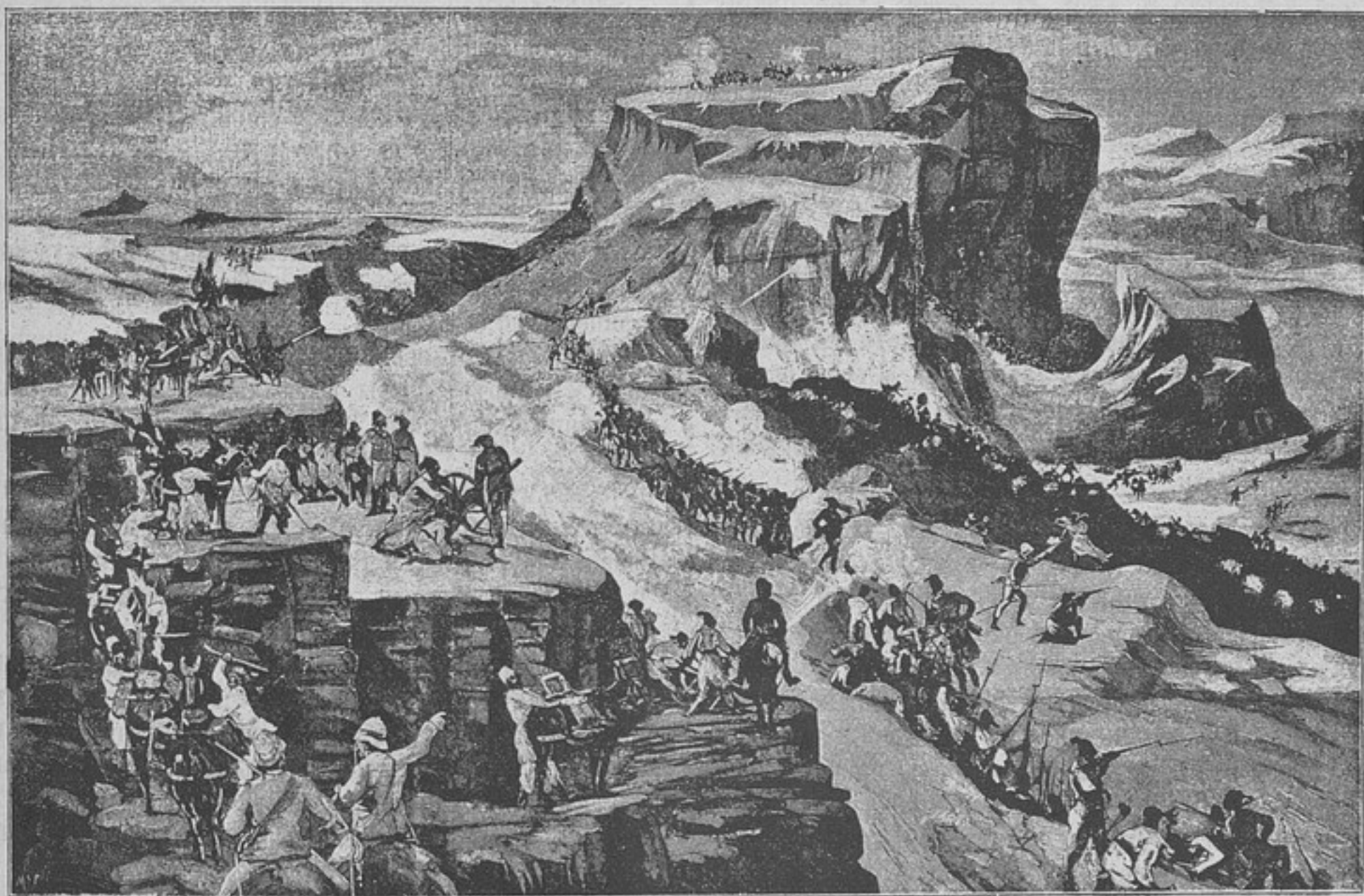
Бой при Дебро Айла (къ рецензій «Императоръ Менеликъ и война его съ Италией»).

Во всякомъ случаѣ слѣдовало бы ограничить подобныя представленія или подвергнуть ихъ цензурѣ мѣстнаго или ближайшаго военного начальства, если полиція не въ состояніи въ должной степени оцѣнить пристойность или непристойность даннаго представленія. Къ сожалѣнію, описываемый фактъ нашелъ мѣсто въ одномъ изъ многочислѣнныхъ городовъ