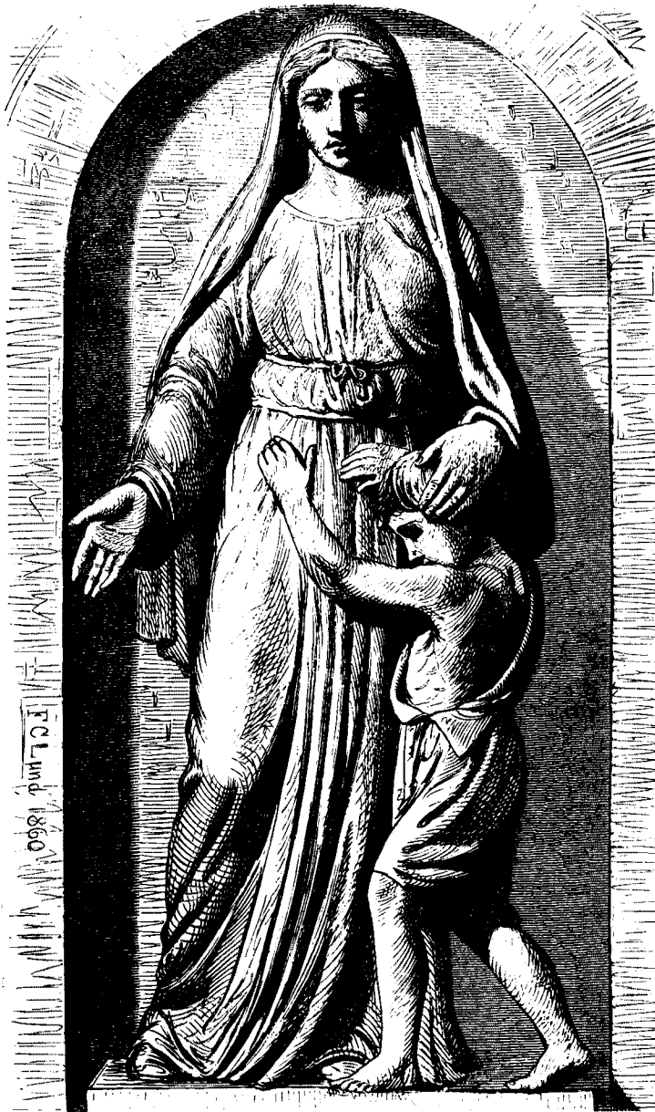
Modertlig Hjærtighed, Statue af Th. Stein.

„Jylland“, Dagens Helt, laa smykket med Flag, nymalet og skinnende imellem to Kamerater, den ene en stor Fregat, „Cort Adelaer“, boret til 56 30 Pds. Kanoner og til en Maskine paa 600 Hestes Kraft, det største Skib, som nogenfinde er bygget paa det danske Orlogsværft; den anden en Corvet paa 16 Stkr. 30 Pds. Kanoner og 300 Hestes Kraft; men disse to Naboer saae ynkelige ud ved Siden af „Jylland“, kun Ribbenene stak iveiret under et høitjovende Tag, og lignede Beenraden af et stort Dyr, der ligger paa Nyggen og er afbleget af Solen. „Jylland“ stod med sin Agterende mod Søen og Forenden ragende høit tilveirs over Menneskemassen, den hvidmalede Figur smilende til Alle, som vare komne ud for at bringe hende deres Hilsen. I de senere Aar bruger man nemlig her, ligesom ved de fleste andre Værfter, at lade Skibene „gaae baglands ind i Vandet“, medens de tidligere altid gik forlænds; for Seilskibe kan den sidste Methode nok