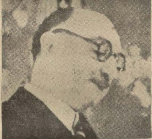
Bir günlük Loyd Corc profesör Akil Muhtar, gazetecilerden korkan profesör Markoviçi, alkol taraftarı Profesör Bensis