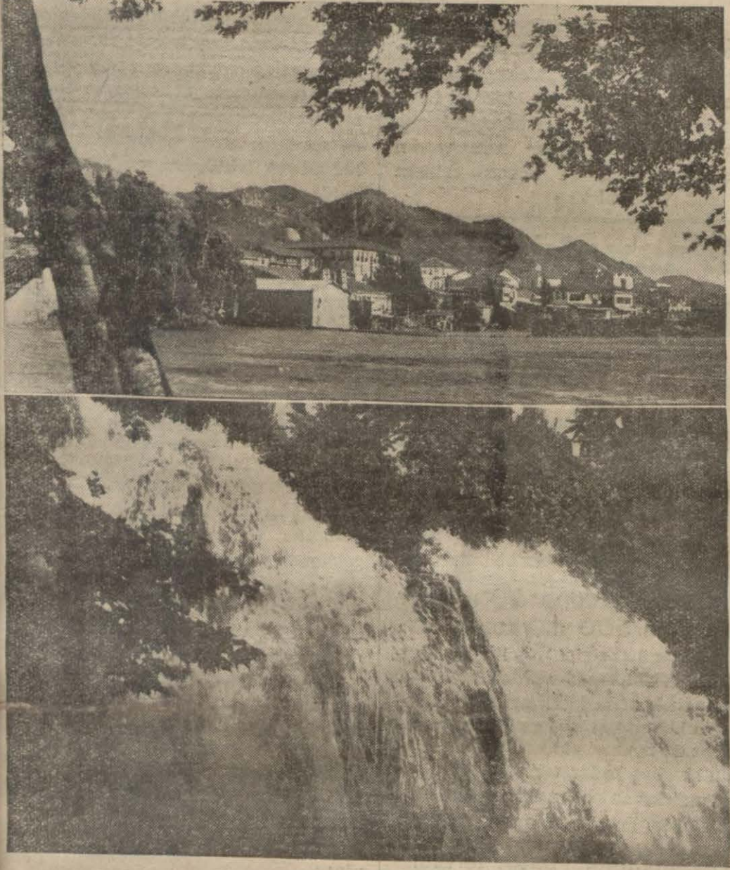
Antakyadan bir görünüş ve