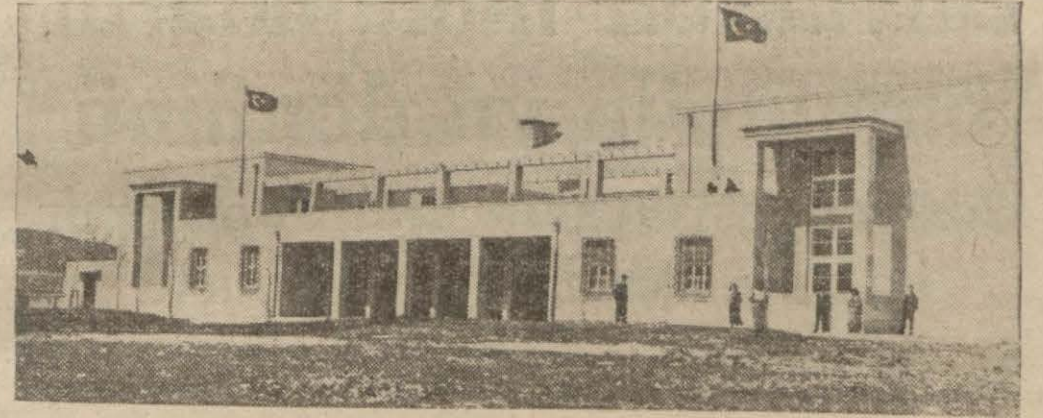
Tiyatro ve opera şubelerini de ihtiva eden Ankara konservatuvar binası

Bu sene opera ve tiyatro mektebine 20 talebe alınıyor, bir kısım hocalar seçildi