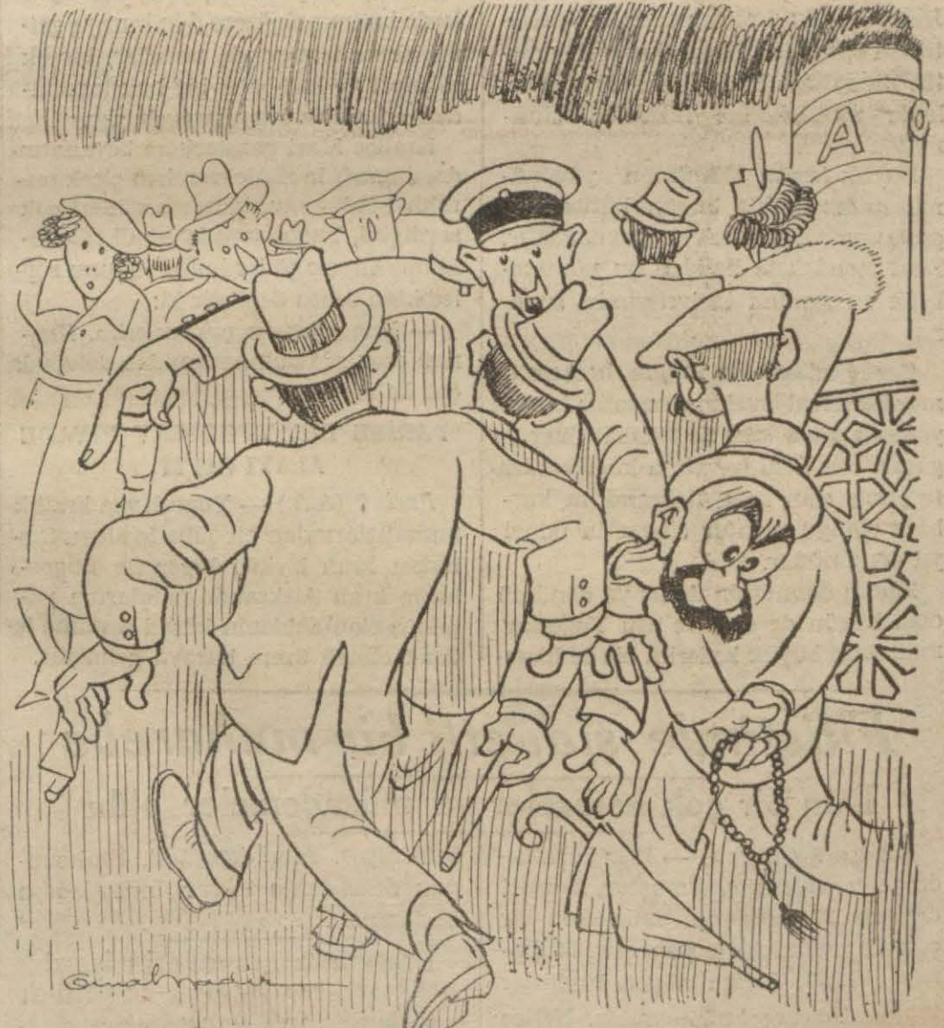
[Memurlar, köprü üstünde halkı sağdan yürümeğe alıştıyorlar.] Gazetelerden İstanbulda sağ - sol mücadelesi!..