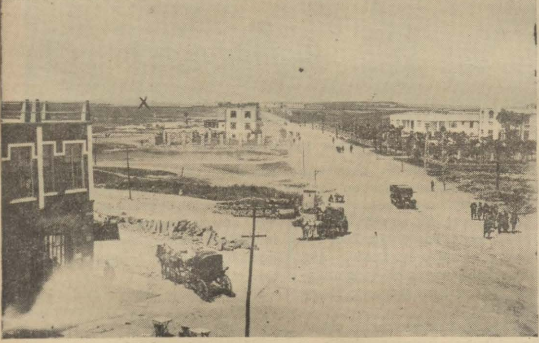
Diyarbakirde Dağkapısının yeni manzarası (Yeni şehir buradan X işaretli yere doğru yapılacaktır)

Yeni şehir surlar haricinde inşa edilecek, bu yıl umumî müfettişlik ve kolordu binaları yapılacak