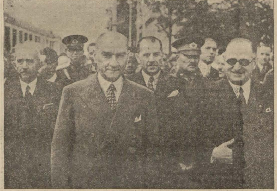
Ankaraya şeref veren Atatürkün istikbal resmine ad bir fotoğrafı dercediyoruz. İstikbal edenler arasında Meclis reisi, başvekil, vekiller, sayıllar ve bir çok zevat bulunmaktadır.