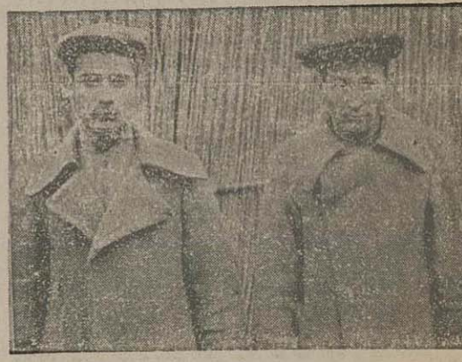
این دو تن از قدایان هستند که از آستانرا بچاک شوروی رفته و اخیرا بایران بازگشته اند.