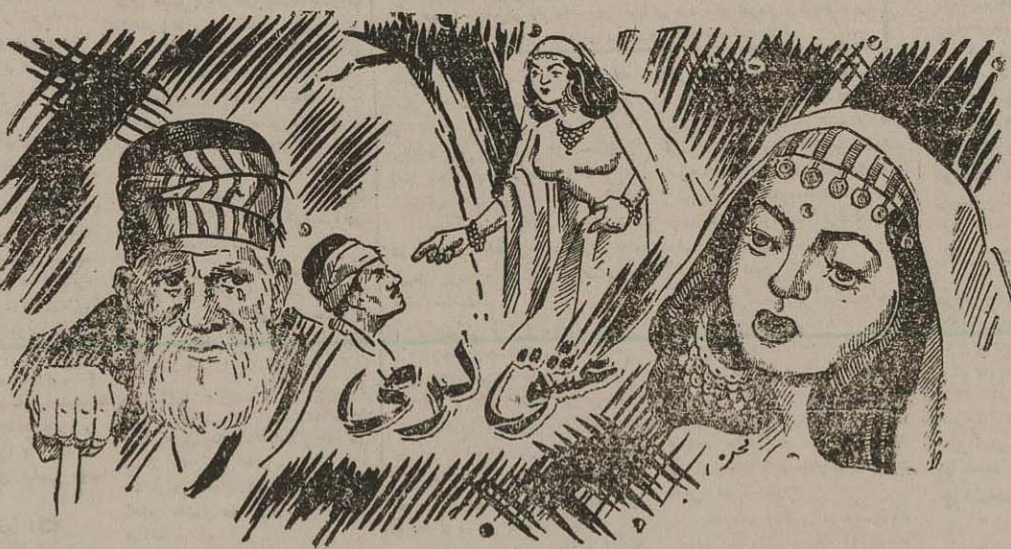
... که دختر کی سباه چشم، گلچهره، بلند قامت خرامان از میان سیزه ها و گلها گذشت، چند قدم آنطرف تر، کنار نهر ایستاد ...