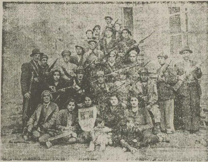
دسته ای از مجاهدین رضایه

و خوابد گفت خود را از خوشی پالین آورد ، لوله طباخ را به پشت گردنش گذاشت . تاس لوله سرد طباخ با بدن فدای اثر بیشتر بهای کرد و او ای فدای مست بود و بر زمین نهفت و شروع بگریه کرد .