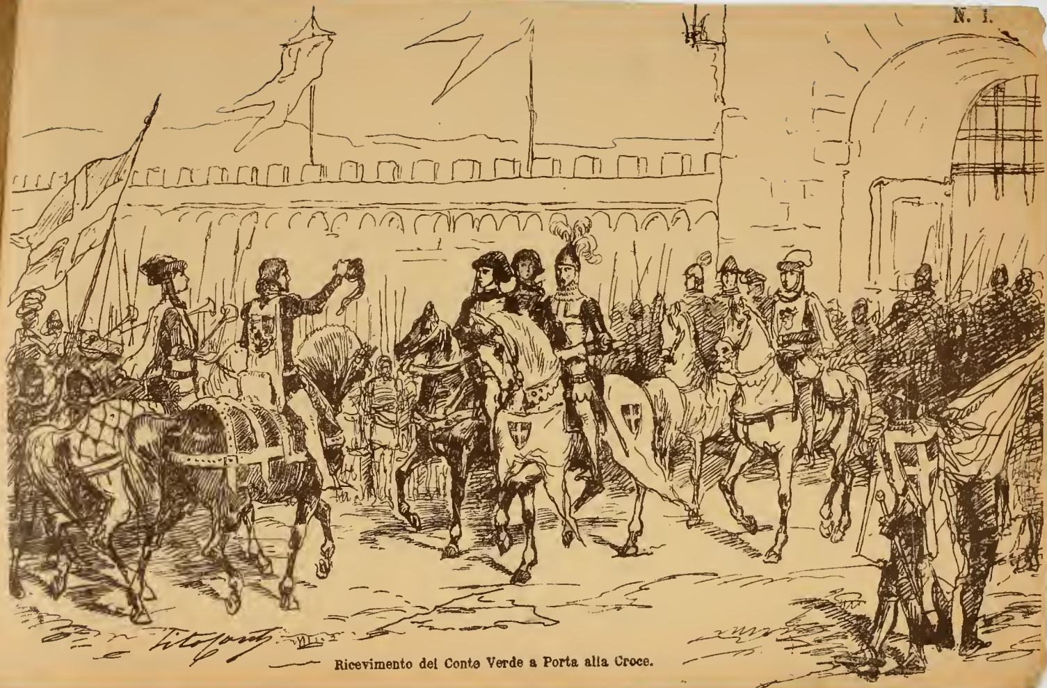
Ricevimento del Conte Verde a Porta alla Croce.