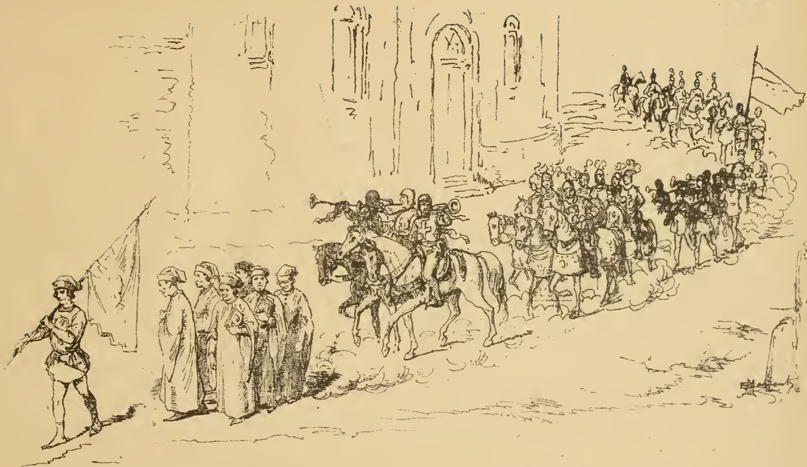
Alfiere della Mercanzia. — La Mercanzia. 5 Ufficiali. — Giudice forestiero e l'inviato de' Mercanti di Lucca. — 3 Trombe a cavallo. — 8 di Guerra. — 6 Trombe a piedi. — 2 Pifferi. — Tavolaccini parte Guelfa. — 2 Donzelli. Porta Gonfalon di parte Guelfa. — 6 Capitani di Parte Guelfa.