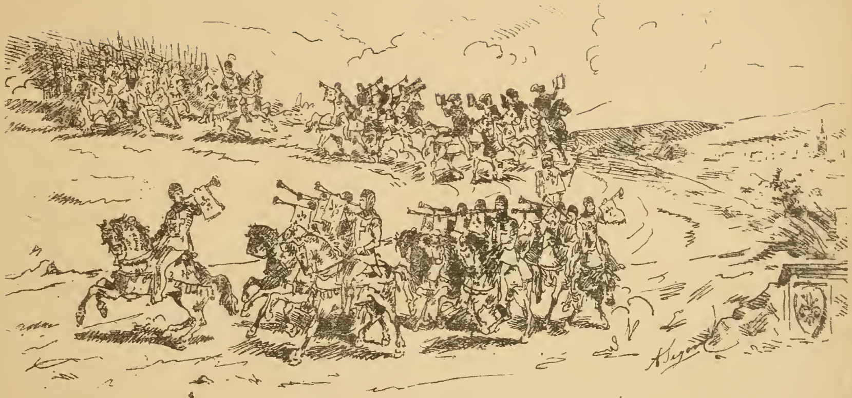
Capo Trombetti. — 12 Trombetti a cavallo. — Araldo del Comune a cavallo. — 4 Banditori del Corteggio. — 6 Trombe a cavallo. — Capitano delle Lance. — Porta insegna delle Lance. — 50 Lance — divisa in due squadre