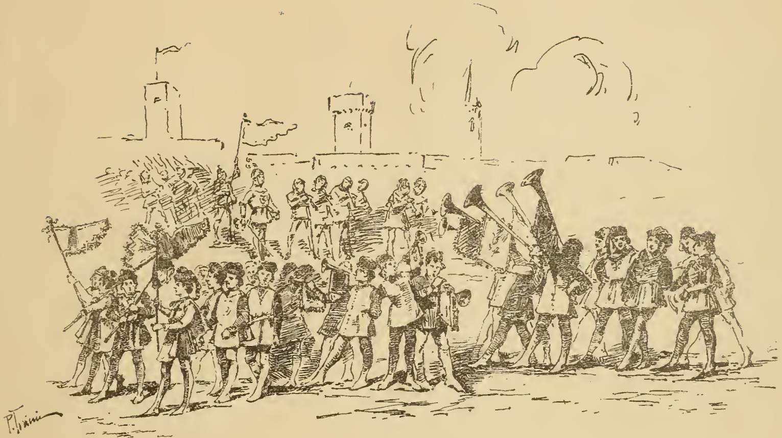
4 Donzelli porta Gonfaloni. — 10 Donzelli dei Magnifici Signori. — 18 Famigli. — 8 Trombetti della Signoria. — 6 Trombatori. — Tavolaccini col Tavolaccino col Giglio. — Naccherino — 2 Cennamelle — 4 Pifferi. — 1 Capitano dei Fanti. — Porta Gonfalone dei Fanti. — 60 Fanti della Signoria.