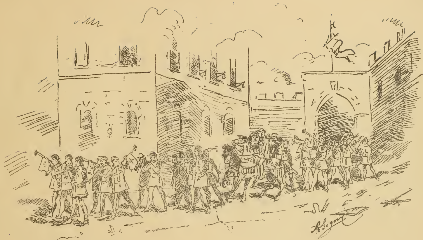
6 Trombe a piedi e due Pifferi. — Capitano dei Balestieri. — Balestrieri. — Ambasciatori di Cortona, Napoli, Volterra, Pisa, Pistoia, ecc. — 3 Trombetti. — 2 a Squadra Balestrieri.