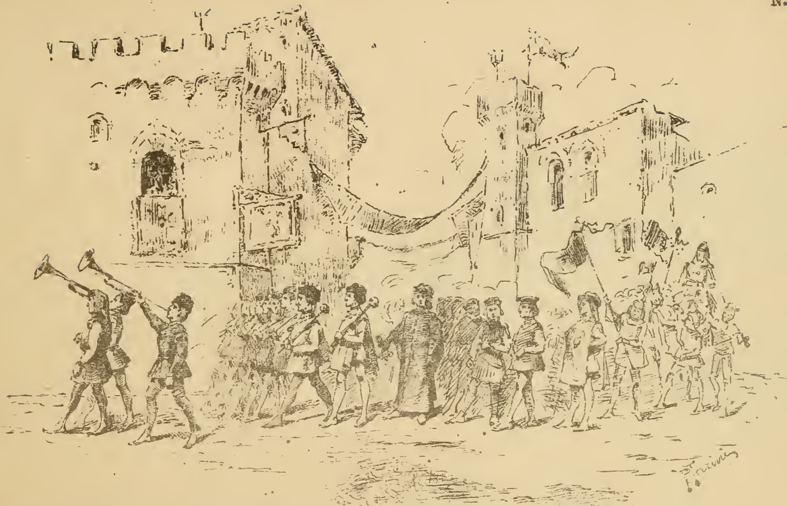
l Araldo tra 2 Tromboni. — 6 Mazzieri con mazze d'argento. — Il Notaro Segretario ed il Cancelliere della Signoria. — 7 Priori delle . Arti. — Porta Gonfalone col Giglio tra due Donzelli. Il Conte Verde tra il Priore Proposto e il Gonfaloniere. — Porta Stendardo - Scudiero del Conte Verde — Cavallo offerto e Paggio del Conte Verde. — Il Castellano di Pontassieve con suo Trombetta. — 6 Lance a cavallo. — 2 Trombetti a cavallo.