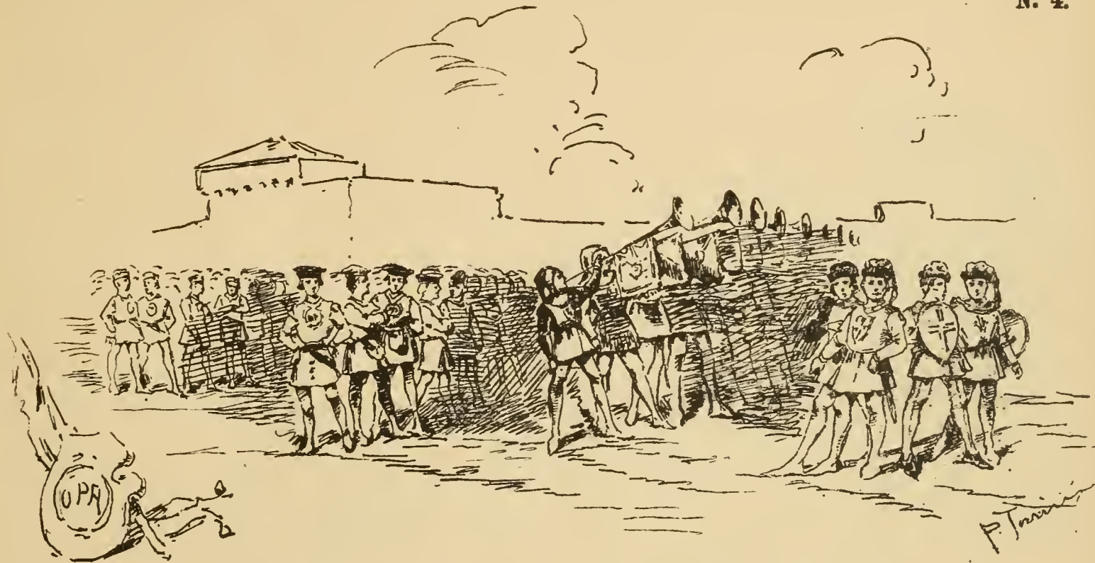
4 Tavolaccini, Arme del Popolo. -- 12 Trombe lunghe a piedi. -- Rappresentanza delle 21 Arti. Minori e Maggiori. Proconsolo -- col Giudice dell'Arte della Lana. -- Opera di S. M. del Fiore: -- Operai della Macchia dell'Opera.