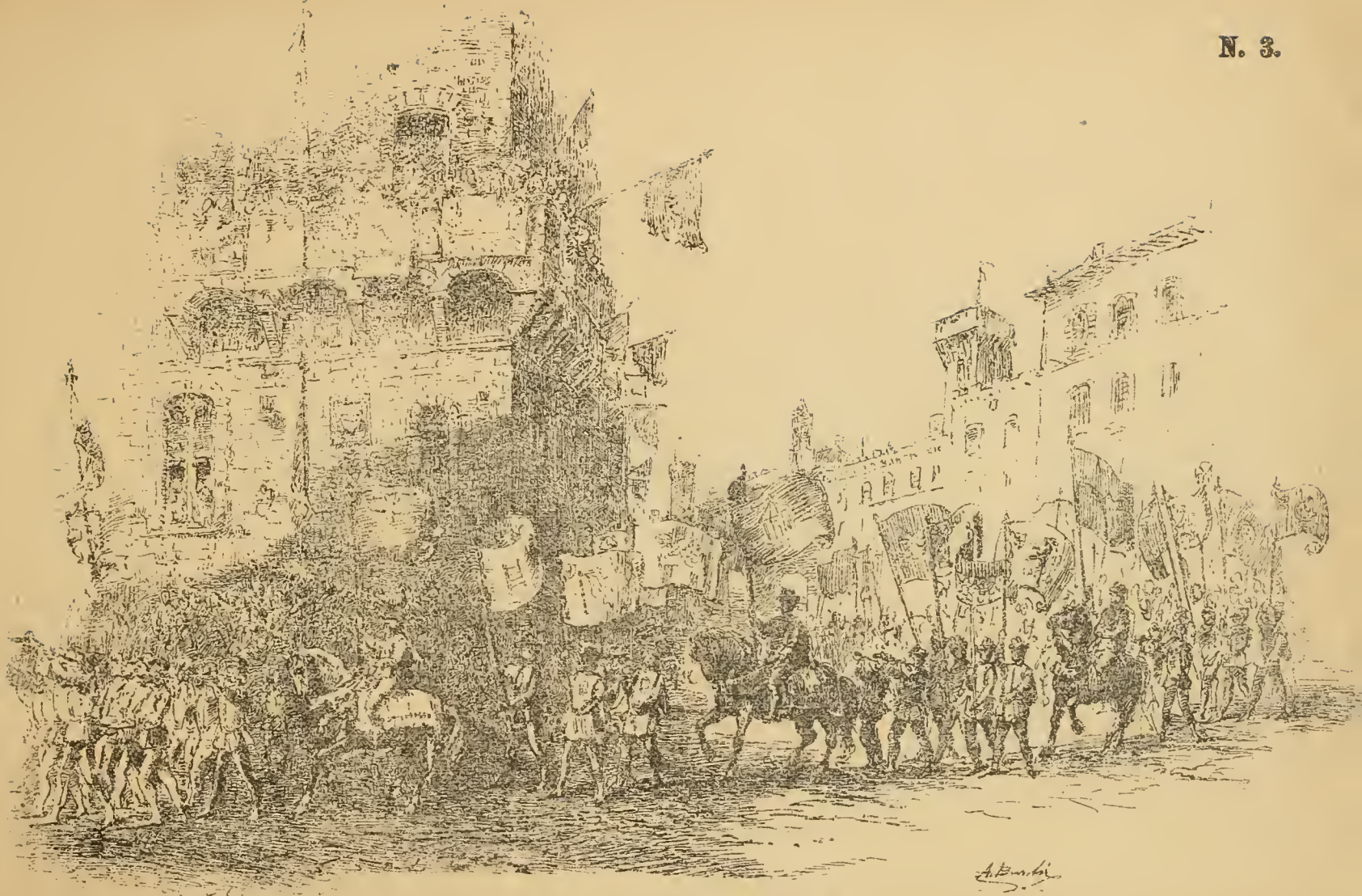
12 Suonatori. — Le 16 Compagnie dei 4 Quartieri di Firenz.