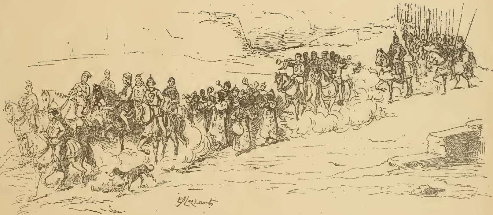
Seguito del Conte Verde. Ambasciatore Greco. - Cavalieri Fiorentini e Forestieri. - Banda Turca. -- 6 Trombe a cavallo. - - Capitano delle Lance e Porta Insegna. -- 25 Lance. -- Capitano. -- 25 Lance.