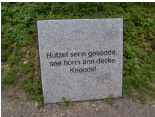
Tafel im Röner Platt

Mittlerweile ist das Projekt aber mehr oder weniger inaktiv!