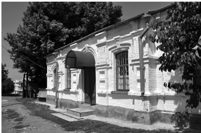
Приміщення редакції, 1968 р.

Кандидат філологічних наук, доцент Н.С.Степаненко (Полтавський національний педагогічний університет імені В.Г.Короленка) у статті «Топоніми Полтавщини в щоденниковому дискурсі Олександра Гончара: інформативні й текстотвірні властивості» наводить таку цитату: