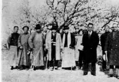
北平研究院副院長李