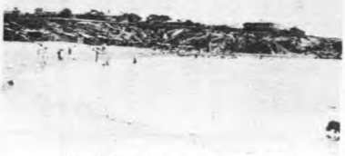
北戴河海濱劉莊石