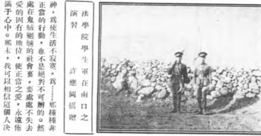
法學院學生軍在門口之演習