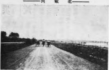
北戴河海濱往東之馬路