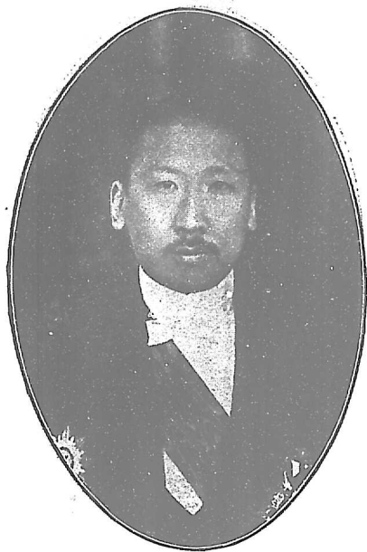
唐 揖 王