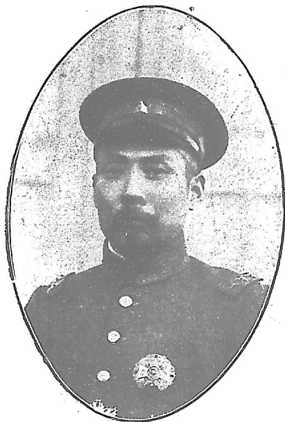
瑞 祺 段