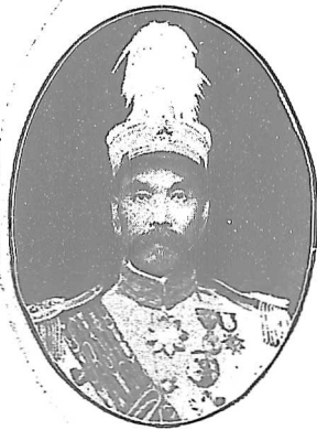
王 占 元