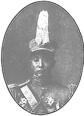
張 作 霖