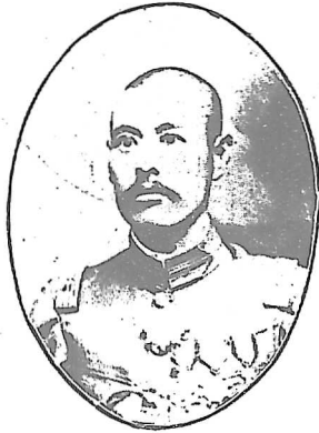
吳 佩 孚