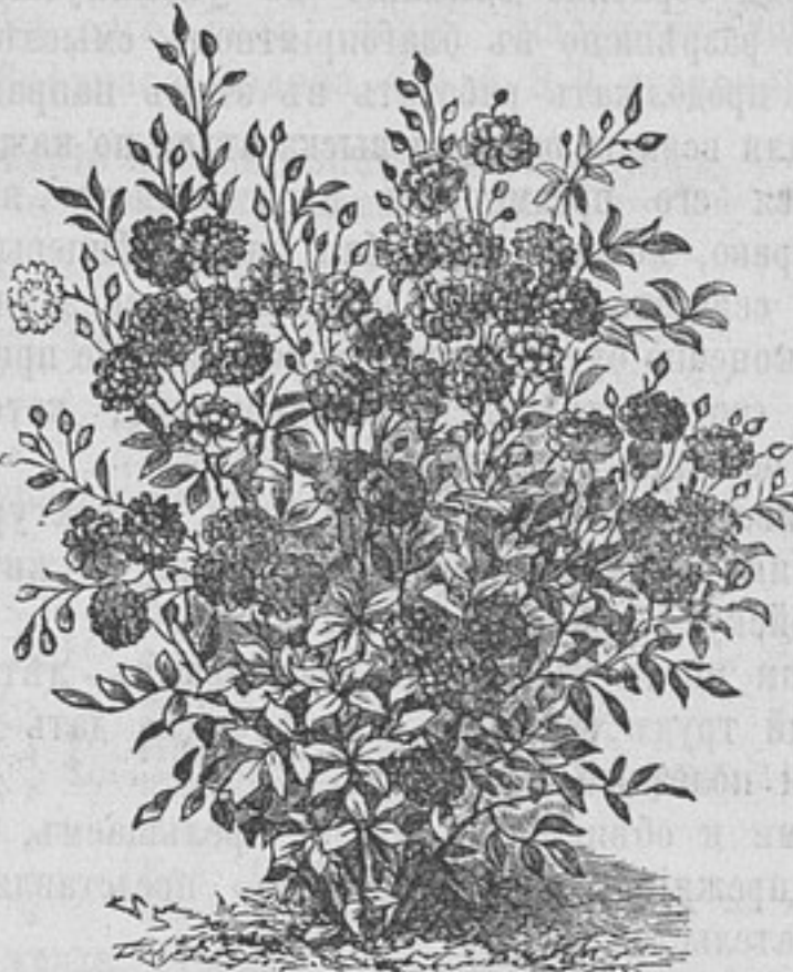
Японская лилипутовая ремонтантная роза.

Сѣмена Муза Энзете (банана). Великолѣпное орнаментальное растеніе для убранства газоновъ и большихъ группъ. При хорошемъ уходѣ достигаетъ къ лѣту 2—3 арш. выш. За 10 зер. 35 коп., за 5 зер. 20 к.