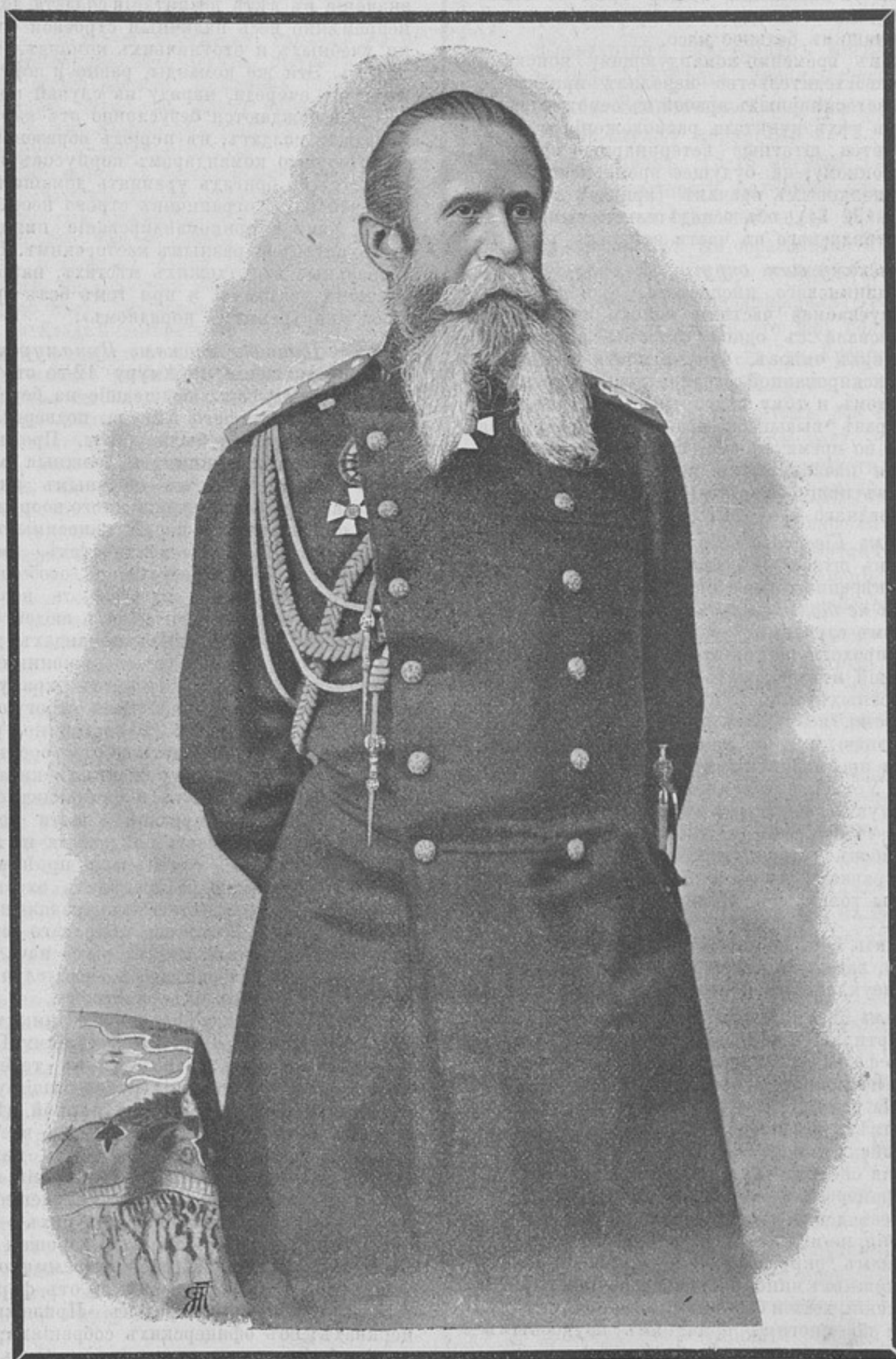
Генералъ фельдмаршалъ Юсифъ Владиміровичъ ГУРКО.

† въ ночь съ 14-го на 15-е января сего года.