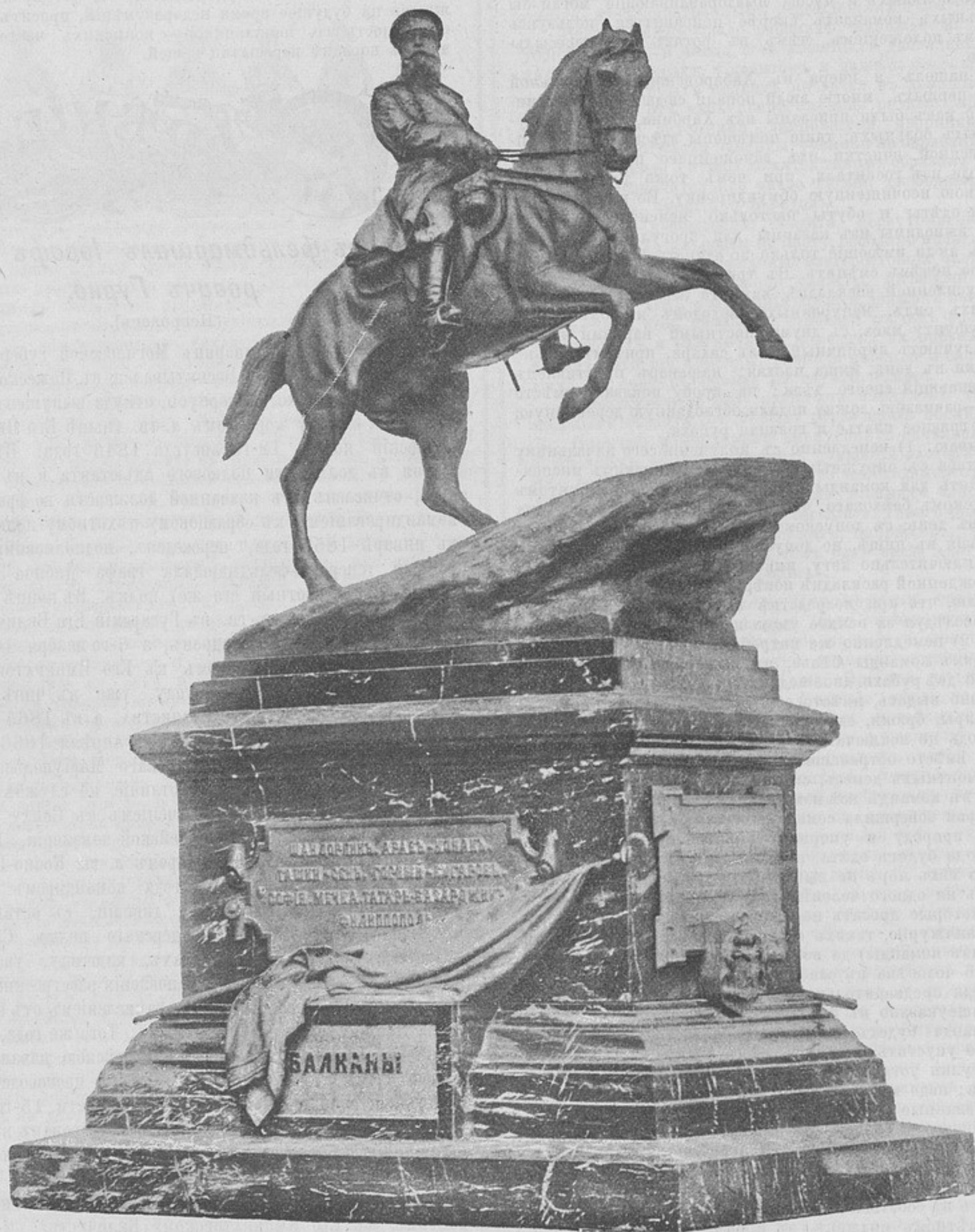
Генералъ-фельдмаршалъ Іосифъ Владиміровичъ ГУРКО.

Хотя замѣчательныя боевыя дарованія генералъ-фельдмаршала Гурко развернулись и нашли приложеніе въ послѣднюю турецкую войну 1877—1878 гг., но еще въ 1849 году онъ, по случаю войны съ Венгріею, находился въ походѣ гвардіи къ западнымъ предѣламъ Имперіи, а затѣмъ въ послѣдующую Крымскую кампанію участвовалъ въ принятіи оборонительныхъ мѣръ, предпринятыхъ для обезпеченія береговъ Балтійскаго моря, и, въ 1856 году, находился въ Крыму на Бельбекской позиціи