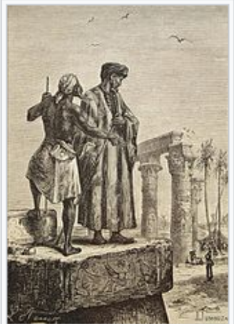
محمد بن عبد الله بن محمد الطنجي

https://ar.wikisource.org/wiki/%D9%85%D8%A4%D9%84%D8%D%:9%81A7%D8%A8%D8%D%_9%86A8%D8%B7%D9%88%D8%B7%D8%A9