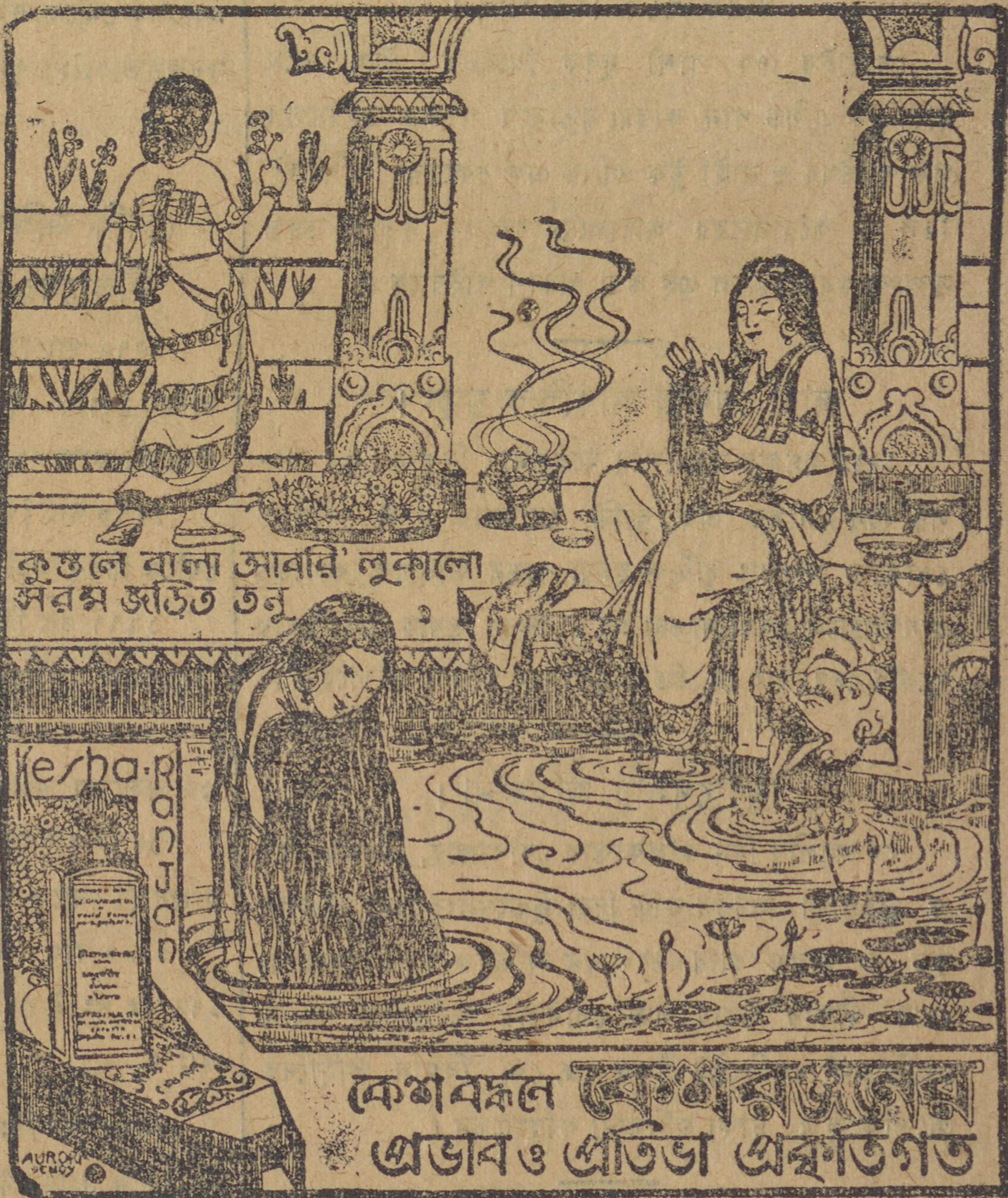
কুস্তলে বাল্য সোবারি লুকালো সর্বমু জড়িত তনু

কেশবর্জল কেশরাজের প্রভাব ও প্রতিভা প্রকটিত