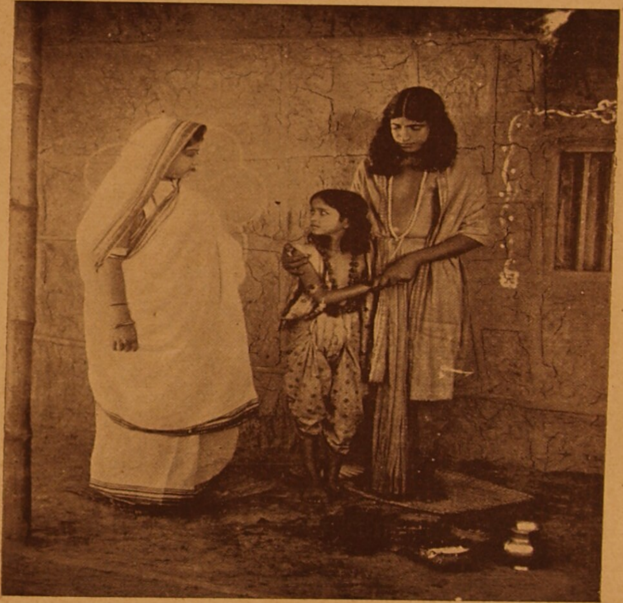
শচী-ছলানের একটি দৃশ্য ।