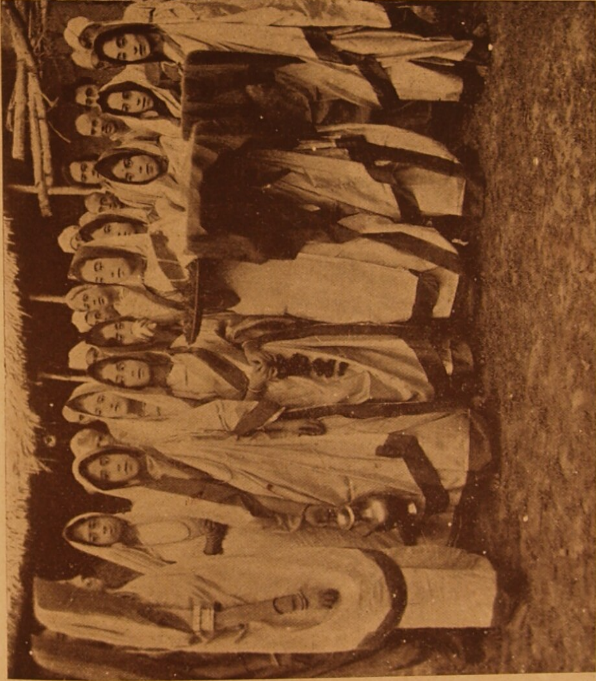
শচী-ছলনালের একটি দৃশ্য।