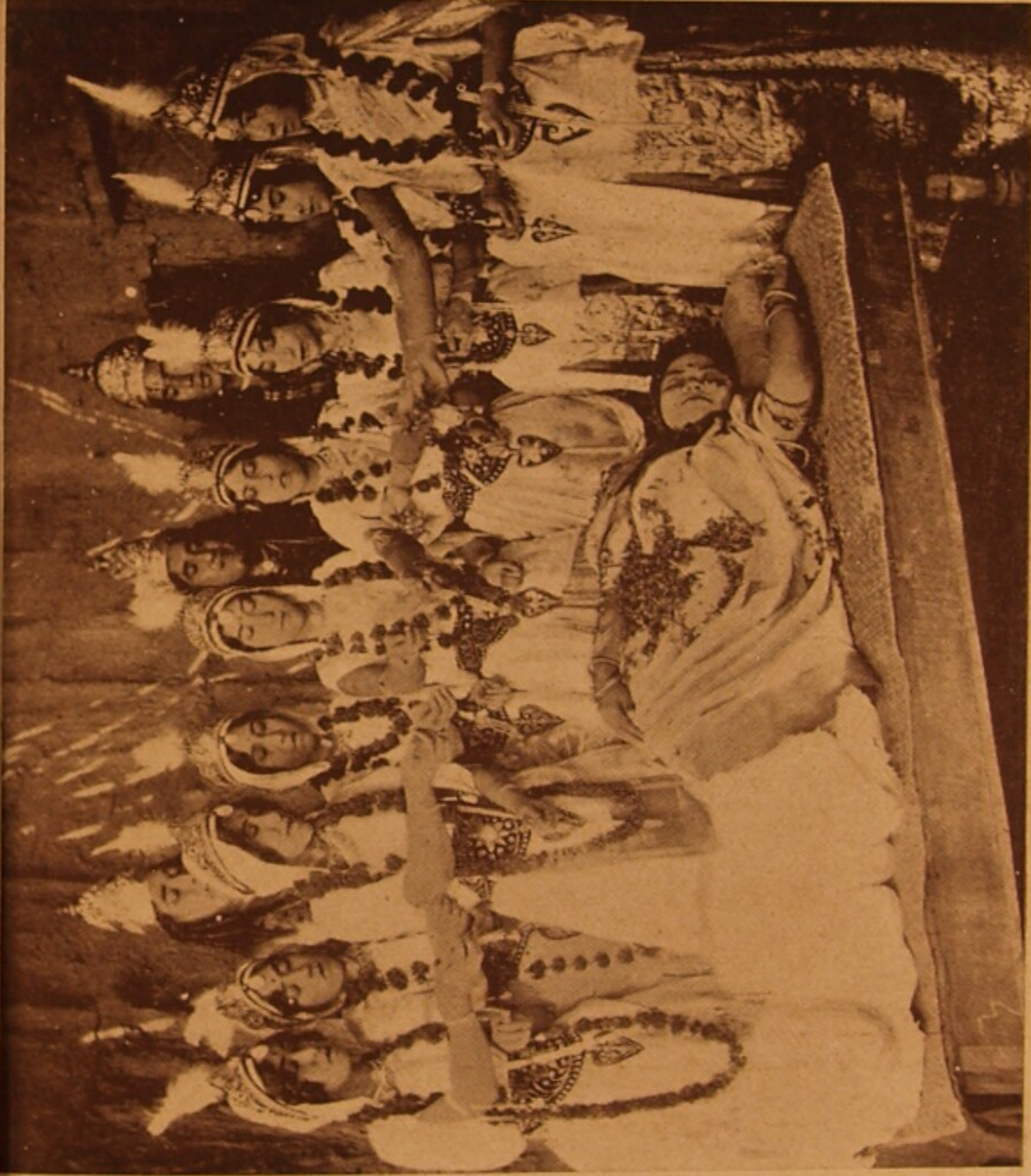
শচী-ছুনালোর একটি দৃশ্য ।