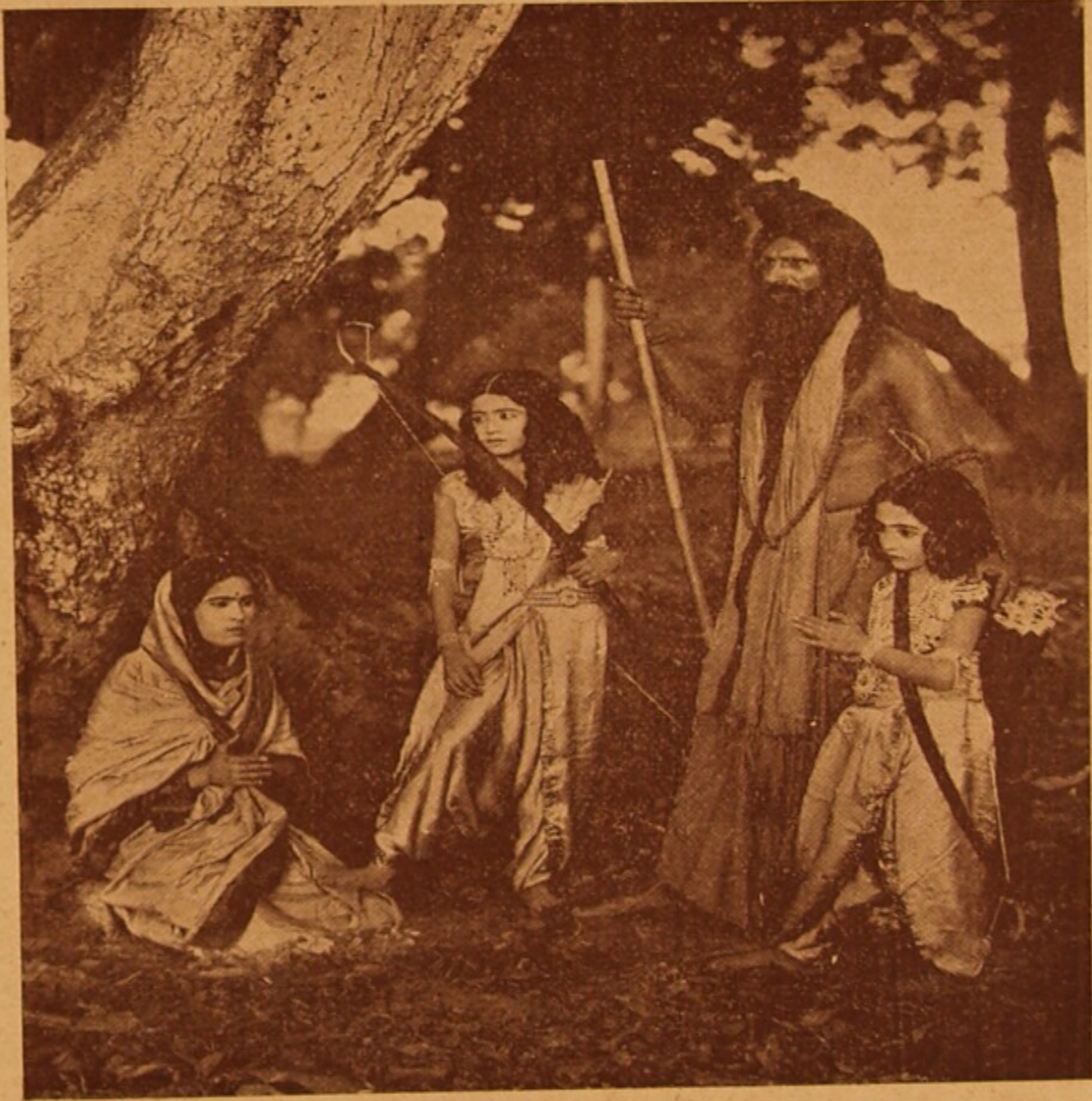
শচী-হুলালের একটি দৃশ্য ।