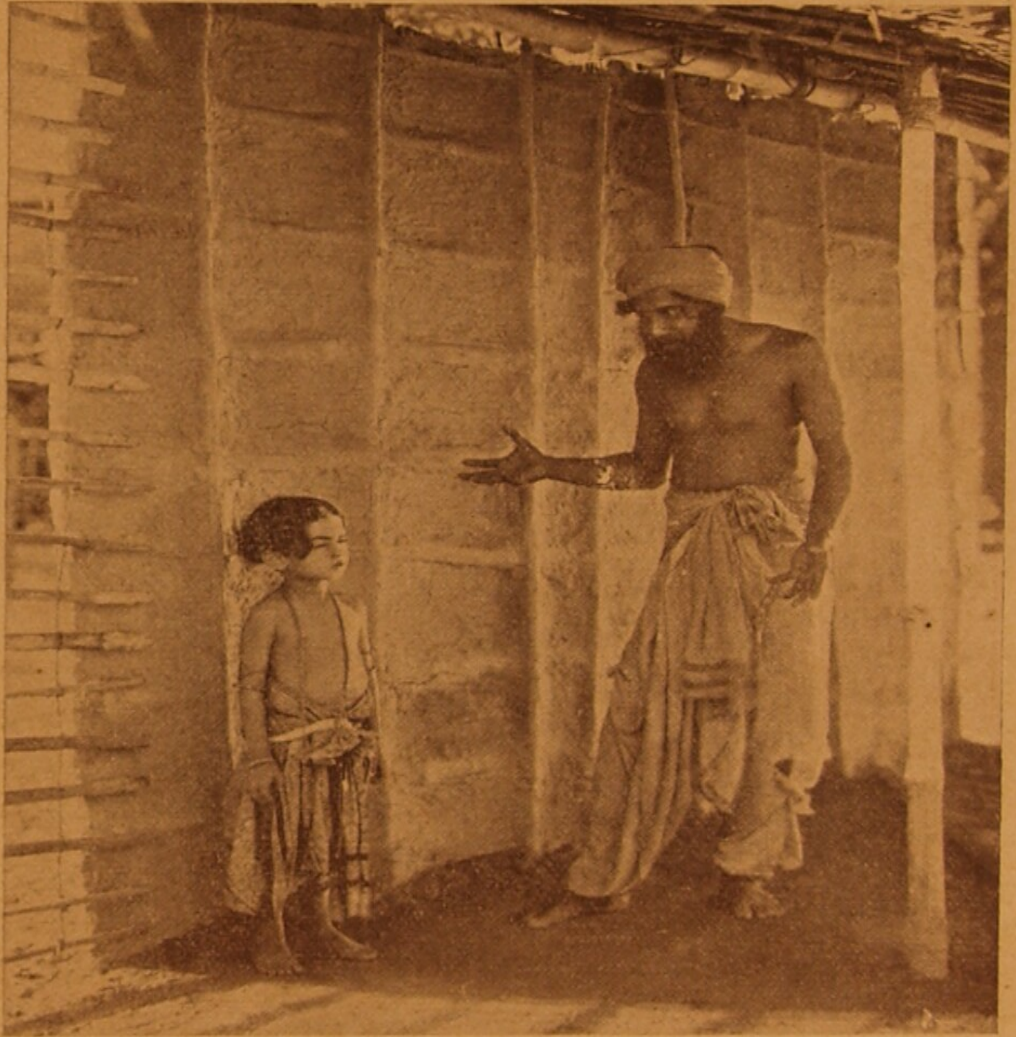
শচী-দুলালের একটি দৃশ্য ।