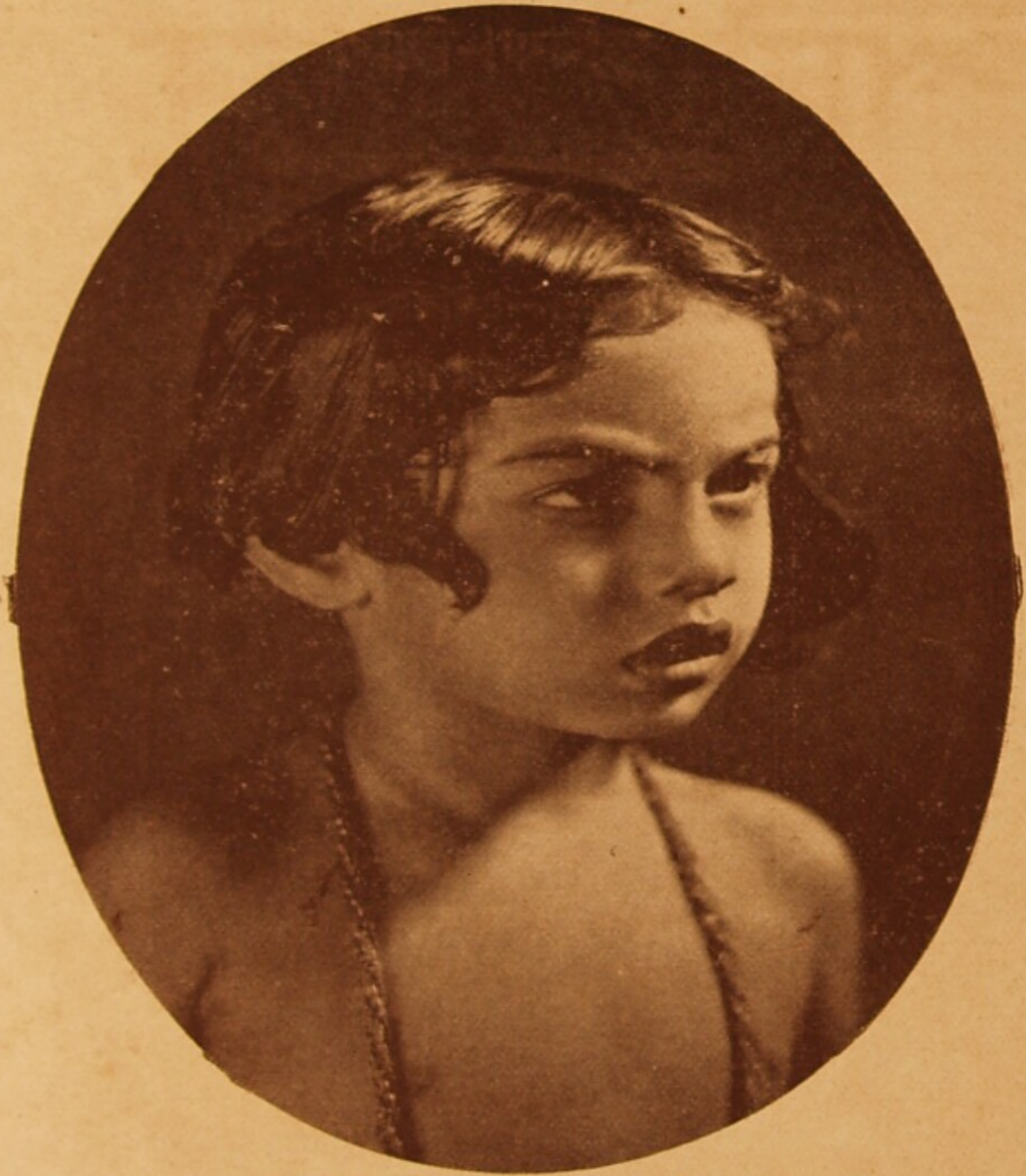
शिशु-निमाई—श्रीमान् बल्लु ।