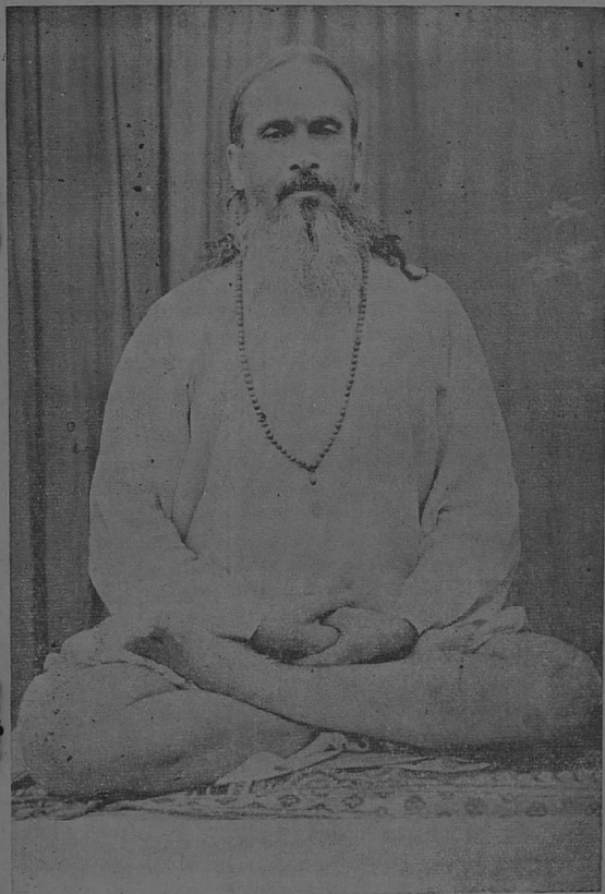
மகரிஷி சுத்தானந்த பாரதியார்