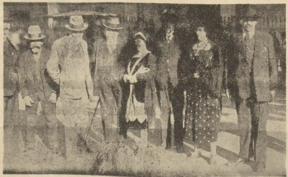
Fransız heyeti ikinci reisinin riyaset ettiği heyetten bir grup

Bükreş'te Parlamentolar kongresine gidecek heyet sehrimuzden geçiyor