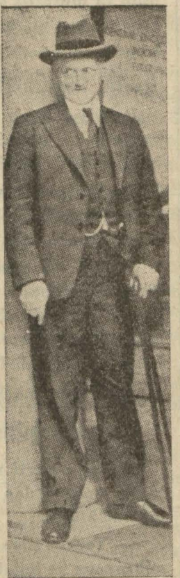
İngiliz Maliye Nazırı M. Snowden

Nevyork borsasında İngiliz lirasının öğleden sonra kaydedilen fiyatında bir çalışma usulü olabilir. Eğer bu usul umumen muvafık görülürse işi İstanbul Vilâyet ve Belediyesinin ele alması icap edecektir. Eğer bu mes'elenin filiyatta tahakkuku için hükûmetin, yani devletin de yardımı lâzımsa İstanbul Vilâyet ve Belediyesinin gösterecekleri icap üzerine bu cihetlerin de nazarı dikkate alınabileceğine şüphe yoktur. İstanbul ve hinterlandı turizmi kendisine celbetmek için neler yapılmak lâzım olduğunu izaha başlıyoruz. Biz bu işin salâhiyet tar, yani az çok bu işte mütehasıs bir heyete tetkik ettirilmesini teklif ediyoruz. İstanbul Vilâyet ve Belediyesi bunu yapamaz mı? Turizm noktai nazarından İstanbul