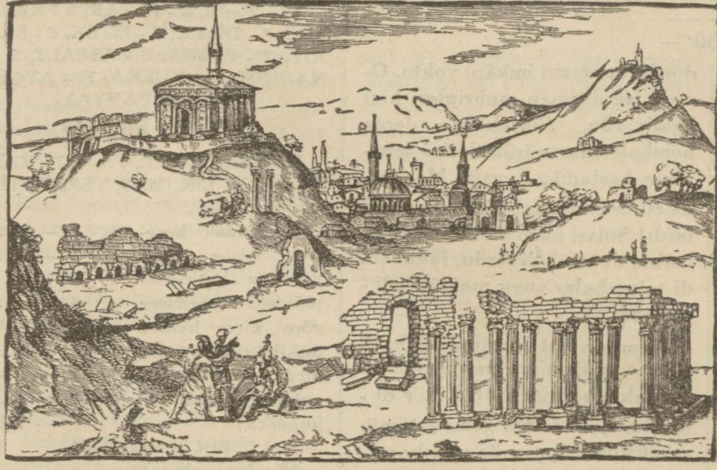
Tarihi bir resim: Atina'nın idaremez zamanındaki bir resmi