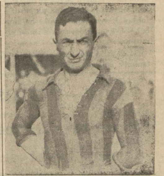
Türk futbolculuğunun göz bebeği Zeki

Futbol federasyonunun, millî takım (Mabadi 4 üncü sahifede)