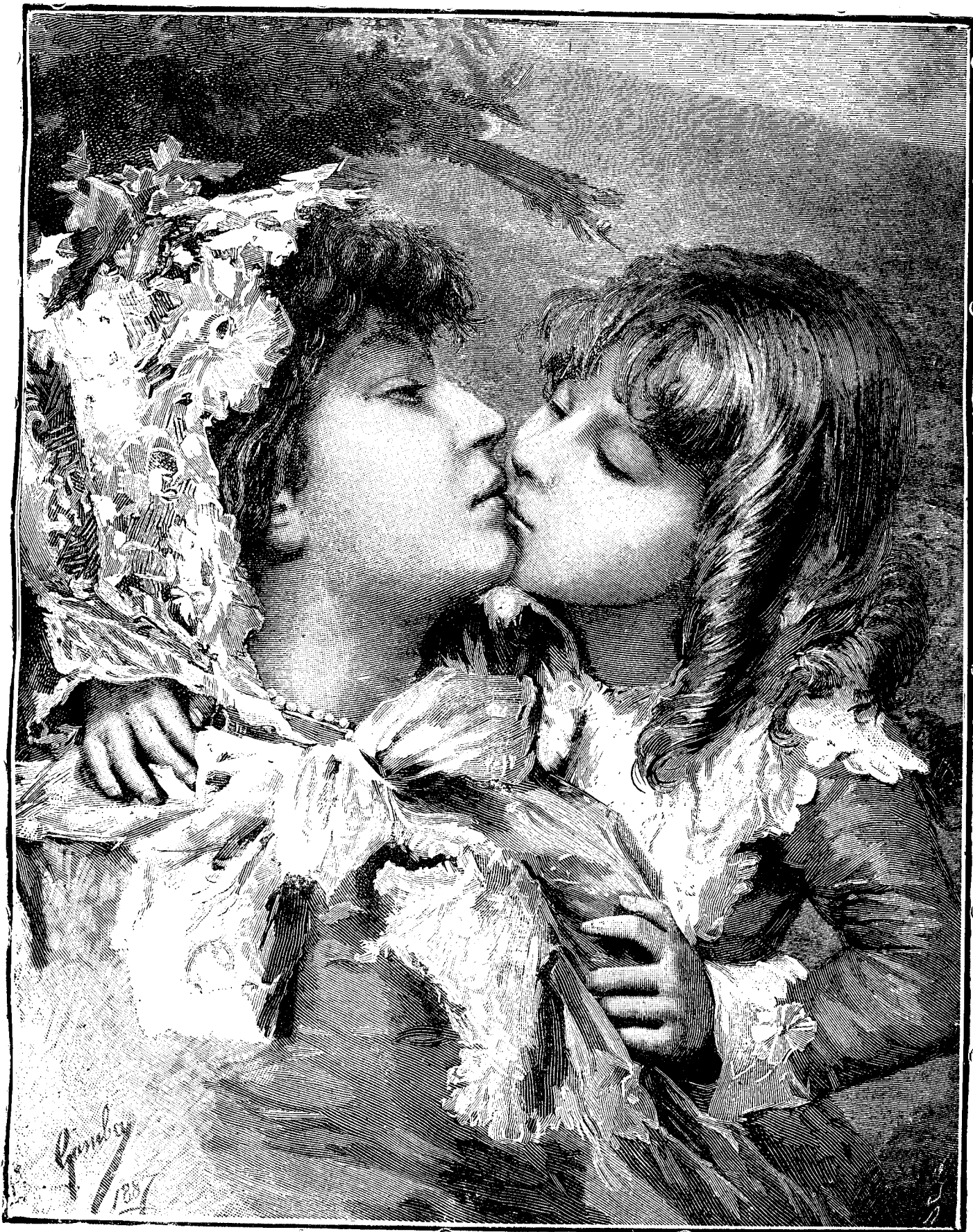
S ă r u t a r e a .