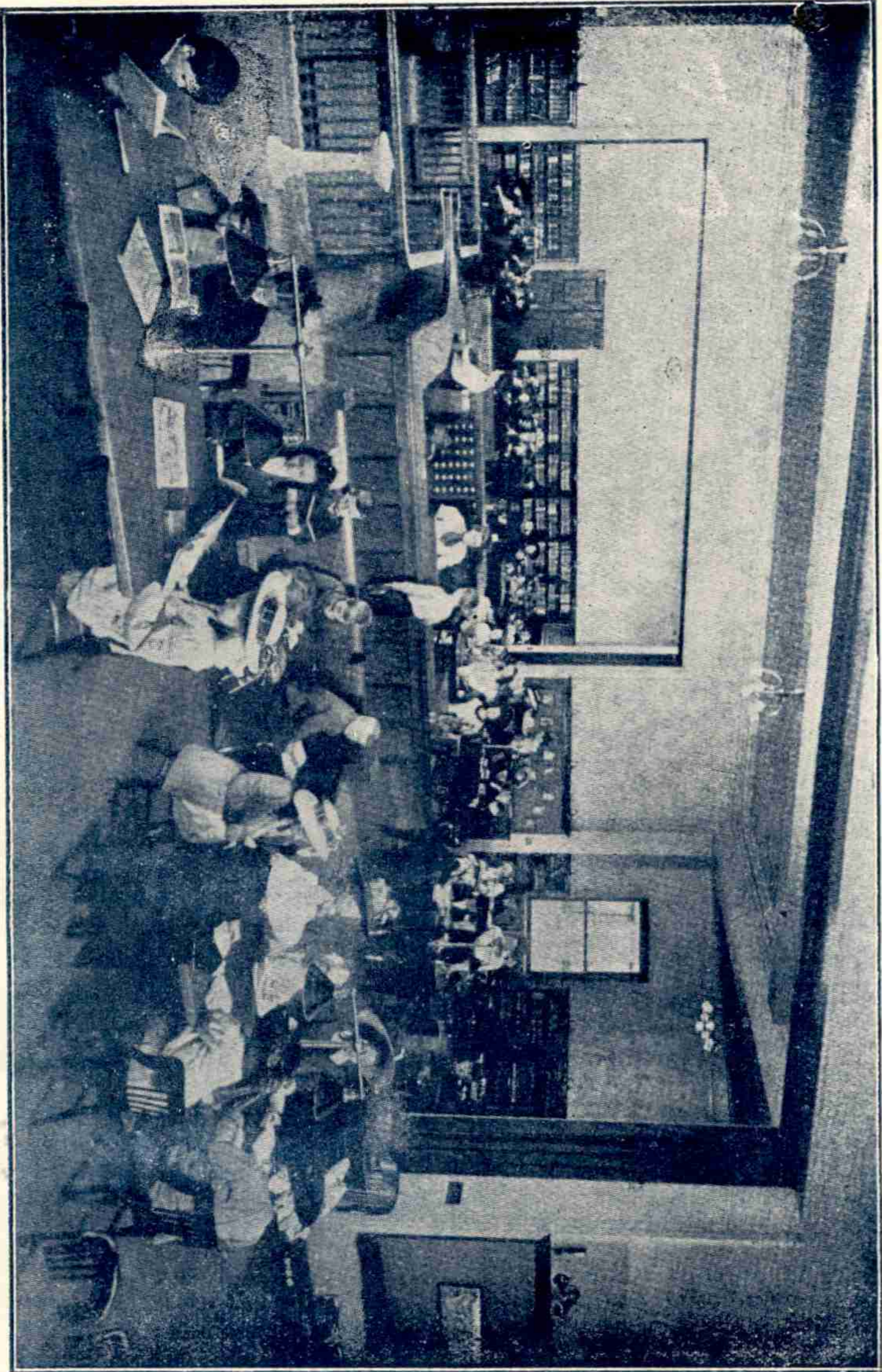
అమెరికా దేశము నందలి "పెట్రుబర్డు" నందున్న కార్మిజీ గ్రంథాలయమునందు పిల్లలు చదువుకొను ప్రదేశము.

పెట్రుబర్డు, కెంటాకీ, అమెరికా దేశమునందు కార్మిజీ గ్రంథాలయమునందు పిల్లలు చదువుకొను ప్రదేశము.