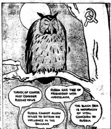
。少愈得說，多愈得聽，鷹頭貓的明聰

忌，宜宣效忠國民政府。此外復有若干引起騷擾的原因。中國在那些年中生氣勃勃，開始推進現代化的建設，並拓展至南滿洲，在南滿洲建築鐵路，其中有幾條與日本管理的南滿洲鐵路並行，而中國資本復建設工業、經濟、商業的各種事業，以與日本相競爭。這些象徵如不能阻止，使中國吸收物資利益，則日本惟有在南滿洲立刻施行正式的政治控制了。此事以及中國對日一般的反抗，便成爲日本在南滿洲的刺激物。局勢緊張達於頂點，小衝突的事件連續發生，至一九三一年九月十八日至十九日之晚，就發生了最嚴重的事變。這或爲日本預定的計劃。至是日本便開始完成了滿洲的征服，而這也是遠東慘劇發展的最後時期。這段歷史的插話及以後的情形，歐洲的混亂，國聯與華盛頓政府調停的失敗，歐洲事變的進行無暇顧及遠東，大家都很熟悉當無詳述必要。