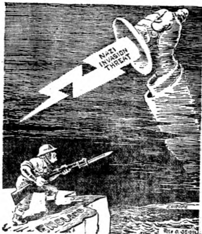
英法海上空戰的閃電戰。

所有這些部隊的分配情形，估計駐在羅馬尼亞的約有十萬至二十五萬人，似乎不至超過八至十個師團。（譯者按：近傳德軍開入保加利亞者已有十萬人，故此項估計現在恐怕已有出入。）大概有一批強大的軍隊駐在波蘭境內俄國的沿界，還有數師團駐在維也納區域，大概有些德軍——特別是空軍的陸上分遣隊——駐在意大利，還有些駐在西班牙。在挪威有一批駐屯軍。在荷蘭、比利時和法國佔領區內駐有很強大的軍隊，還有