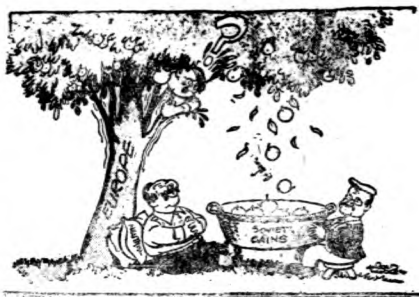
成其收坐國俄，果結力勞國德

行，不稍怠忽，否則禍及其人之身！我們的情形怎樣呢？有人問一般專家們說：「一月內須費多少時間，建造多少飛機或多少坦克車。」專家們胡亂檢定一日期，就尊重他們的決定去做。實在我們製就的時間表太落後了。這次的戰爭，我們應該有專門緊急準備的管理，不應該讓專家們管理軍事的需要品，以致結果，我們準備在一九四二年的戰爭，在一九四〇年已經過去了。」