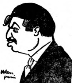
爾 伐 續

治。少數黨方面的服從以什麼為必要的條件呢？這就是多數黨的行動，應以公正無偏為保證。在議會和民主形式的政府，一黨當權，切不可視為迫害國內其餘各黨的弊端。英國自由黨與保守黨，都能够接受政黨的更迭一些不起恐慌，即在今日保守黨與勞工黨的情形也確然如此，因為勞工黨為英國工人的利益辯護，是不會成為革命的政黨的。」 「在法國，」我說，「議會機構的活動，自社會黨成為國會最大的政黨而與共產黨結合之後，已全部脫失了它的齒輪。極權哲理與議會制度兩者之間，你祇能任擇其一，不能兼而有之。你不能盼望法國中等階級，接受有計劃摧毀它們陣營的人取得權力，認為政府中之平常事件。迨至兩黨恐怖心理與感情衝動。超越愛國思想之上的時候，法國的民主政治就分裂起來，不能再獲