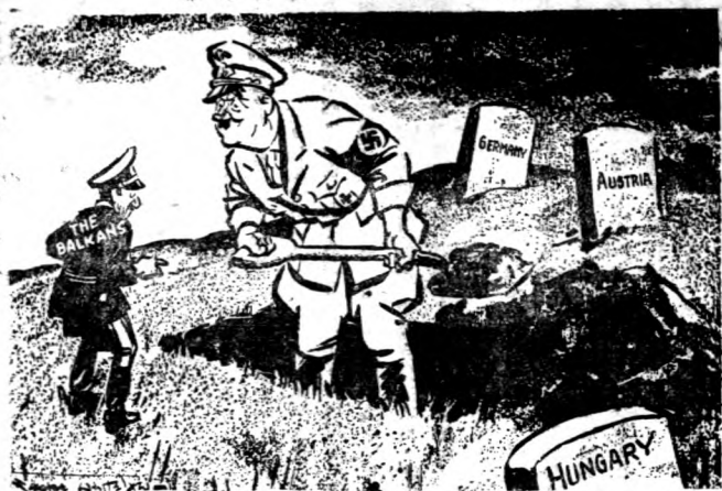
希特勒向巴爾幹說：「你佔一塊葬身之地吧？」

得新生的力量。同時廣募後備兵員，由專家襄助，訓練成爲現代化精銳陸軍，以樹立軍權。軍閥反對無效且亦無實力反對，蓋軍閥禍國殃民已失人心，他們的武力不過表面可觀，經不起訓練有素的國民黨軍隊的掃蕩，此因國民黨軍隊不但深知作戰的目的，抑且擁有